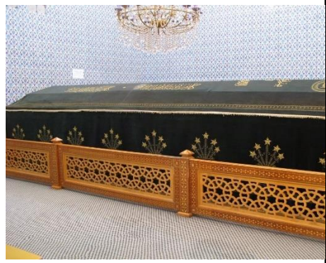
Wêne 6. Tirba Nebî Nûh