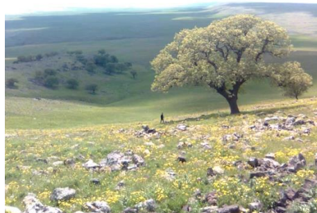
Wêne 2. Wêne ji Serê Girê Êlim