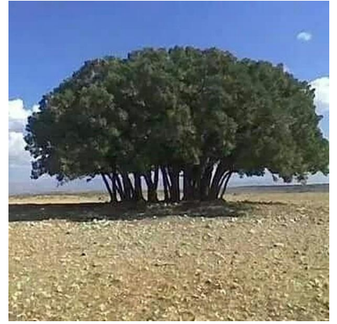
Wêne 8. Tê Bawerkirin kû Xwîna Fadil Bûye Ev Devî.