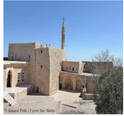
Wêne 12. Dêra Mor Dodo