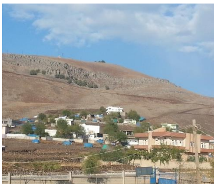
Wêne 1. Girê Êlim

Cih: Rîzok/Hezex. Ji dayikbûn: 01.01.1947