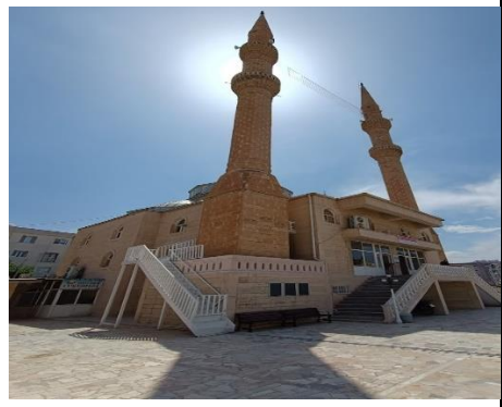
Wêne 4. Mizgefta Nebî Nûh