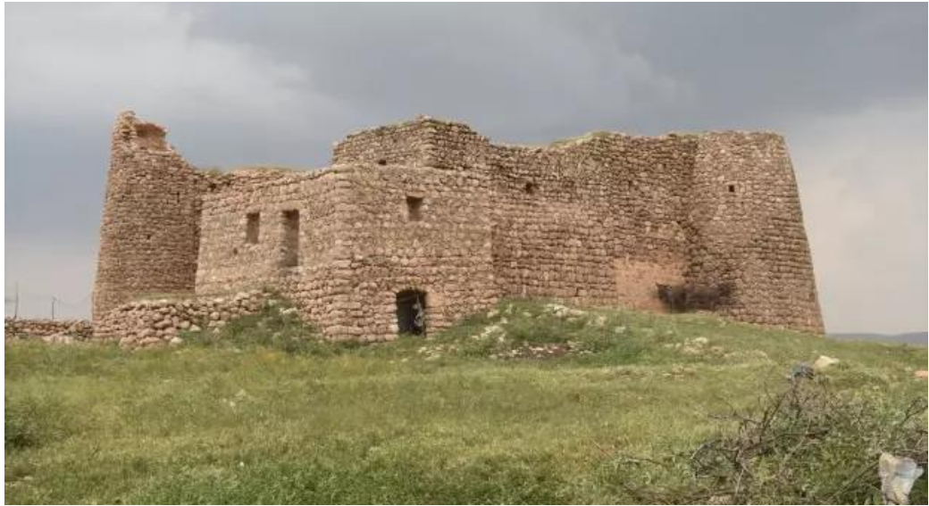
Wêne 9. Dêra Mor Basûs li Bakûrê Gundê Hedilê Berî Restorasyonê