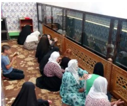
Wêne 5. Mirovên li ser Tirba Nebî Nûh Dûa Dikin