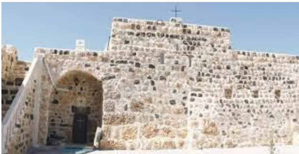
Wêne 10. Dêra Mor Basûs Piştî Restorasyonê