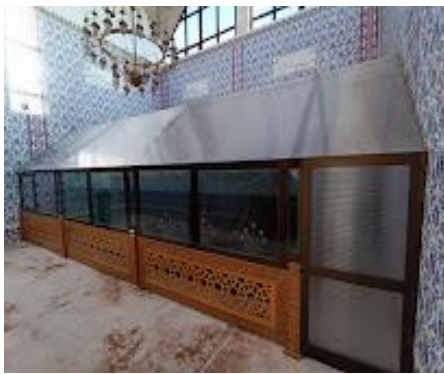
Wêne 3. Tirba Nebî Nûh

bawermendên wî xwe negirtin û wê rojê cejn çê kirin û xwarinên di keşteyên de heyî hemî kirin nav hev de û kelandin û xwarin. Lê av zû ne vekîşiya û çendekî li serê çiyayê Cûdî şepirze bûn. Piştê av bi temami vekîşiya û bi selametî xwe berdane xwar. Keça nûh stewr bû û zarok jê re çê nedibûn. Lê mûcîzeyek çêbû ew keça wî biheml bû zarok jêre çêbûn. Li gorî baweriyekê mirovên cîhanê tev xirêza keça Nebî Nûhin. Hên jî tirba Nebî Nûh li Cizîrê ye û her tim mirov ji hemî deverên cîhanê qîsta ziyareta Nebî Nûh dikin. Tê li vê mizgevtê dûa dikin û yê nexweş şîfa dibînin yê feqîr dewlemend dibin. Li gor baweriyekê gelê cizîrê pir dewlemende û ew dewlemendiya wan bi xêra Nebî Nûh e. Behtir gelê herêmê tene ser tirba Nebî Nûh (Zeynep Göktaş, 29/01/2024).