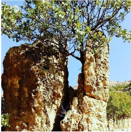
Wêne 7. Tê Bawerkirin kû Ev Dar Keziyên Şûşanê ne.

bûn an jî gûrî bûn tèn xwe bi vê avê dişûn û şîfa dibînin (Halise Aslan, Hezex Gundê Hedil, 30/01/2024). 3