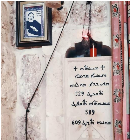
Wêne 13. Dêra Mor Dodo