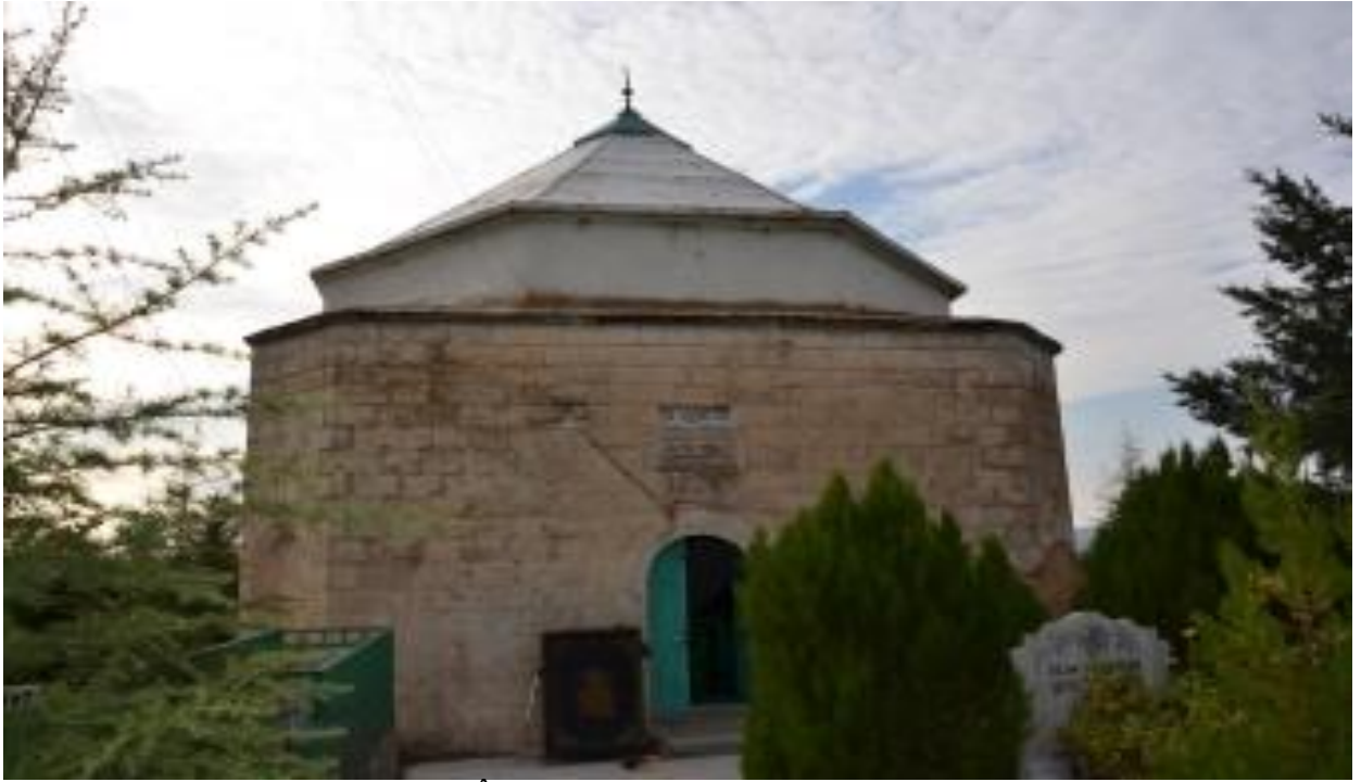
Sûret-9 Ji Derve Zîyareta Quba ZÎLAN