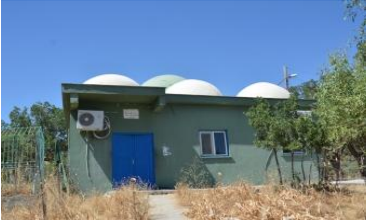
Sûret-5 Ji Derve Zîyareta Seyîd Bîlal 1