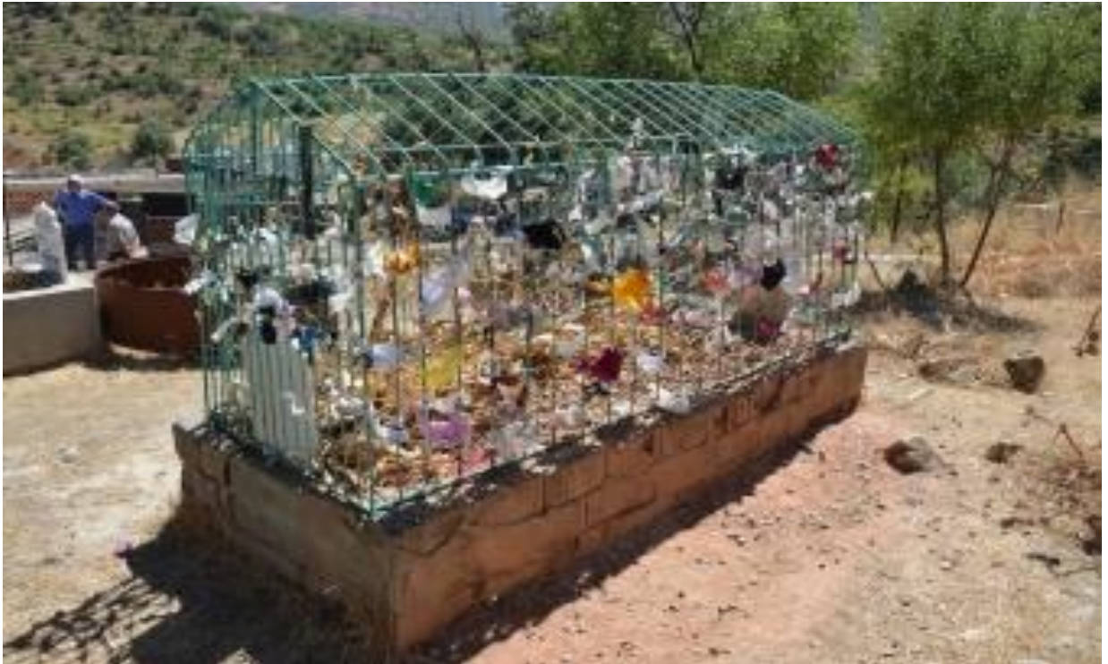
Sûret-4 Paç/ Paçikên li Ziyareta Seyîd Bîlal