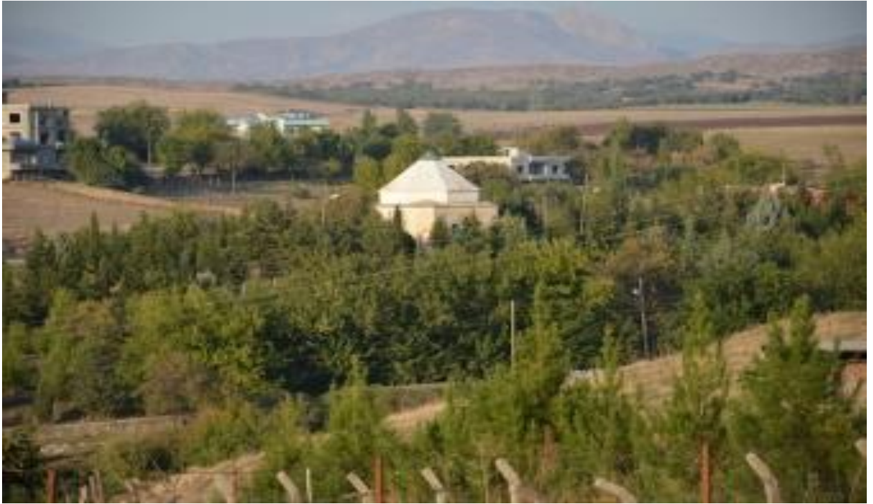
Sûret-10 Ji Dûr ve Zîyareta Quba ZÎLAN