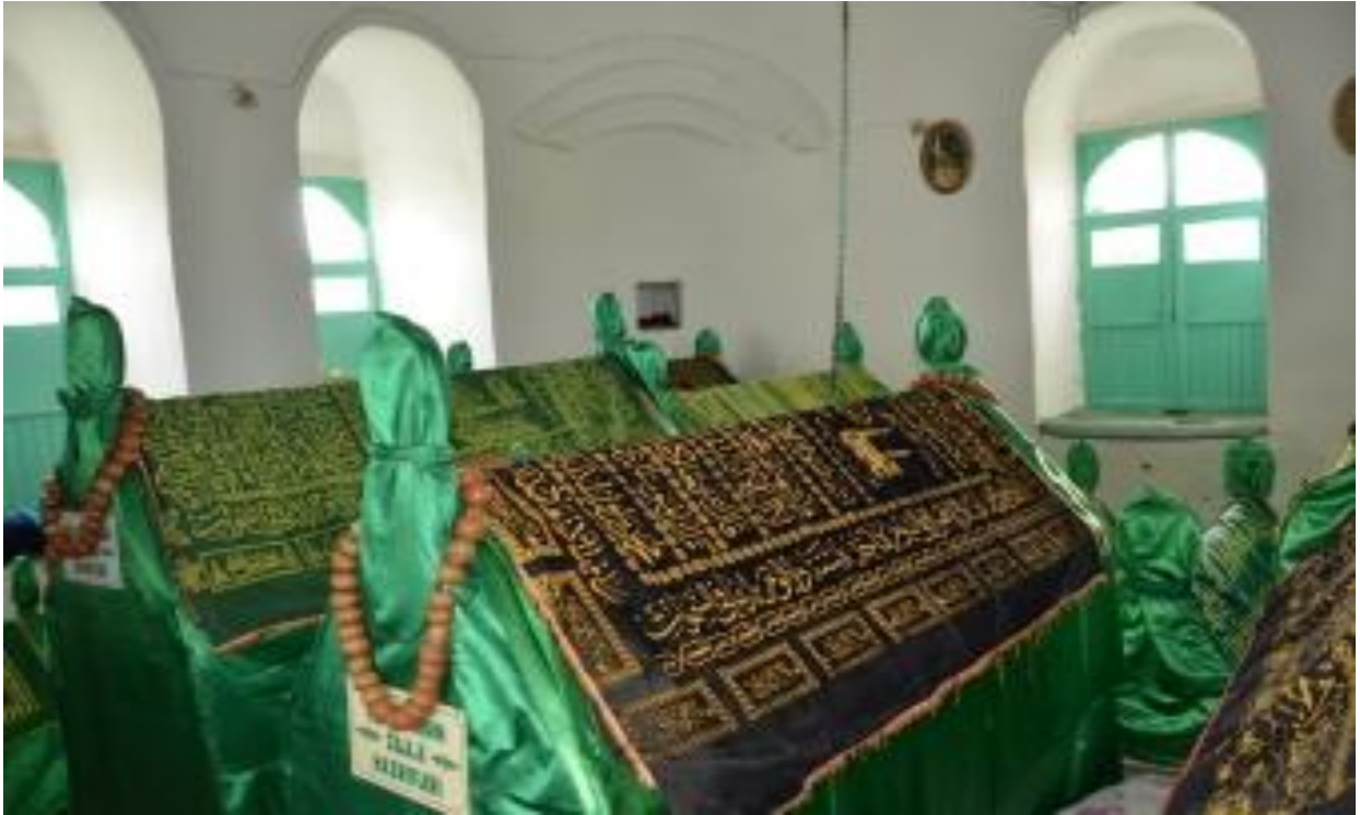
Sûret-8 Hundirê Zîyareta Quba ZÎLAN 2