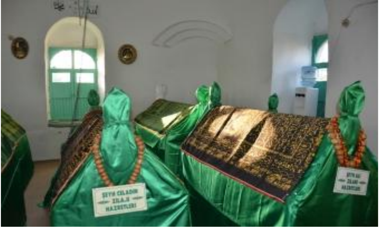
Sûret-7 Hundirê Zîyareta Quba ZÎLAN 1