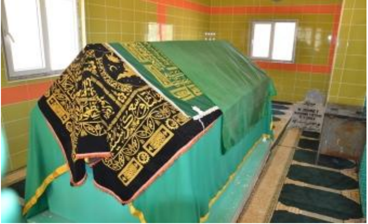
Sûret-1 Hundirê Ziyareta Seyîd Bîlal 1