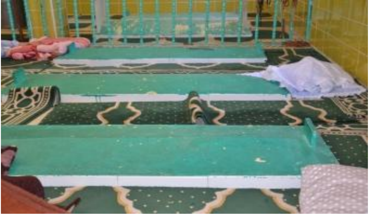
Sûret-3 Hundirê Zîyareta Seyîd Bîlal 3