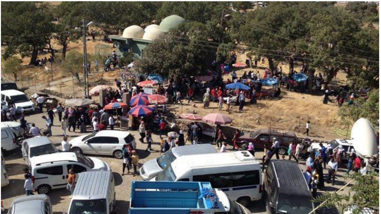
Sûret-6 Ji çalakiyên Zêw'ê