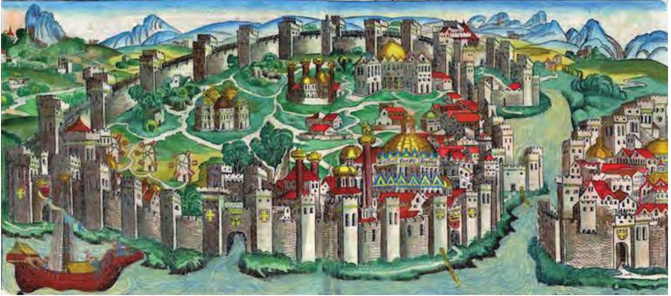
Resim 5. 15. yüzyıl Konstantinopolis kent görüntüsü, gravür; Hartmann Schedel, Liber Chronicarum , 129r-130v, 1493 yılı (Borvovalı 2019, G.1.)

Geç Antik Çağdan, Orta Çağa kadar tarihlenen çeşitli el yazmaları günümüze gelebilmiştir. 38 Bunların büyük çoğunluğu Hıristiyan dini konulu resimli el yazmalarıdır. Kent tasviri içerdiği bilinen en erken tarihli dini konulu resimli el yazmaları 586 tarihli Süryanice yazılmış Rabula Dörtlü İncil'i ve