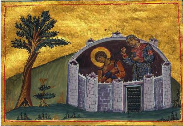
Resim 9. Vat.gr.1613, "II. Basil'in Menolojisi", fol.44, 10.yy.

“Ay Kentinde İsraililerin Galibiyeti” konulu resimde 49 görülmektedir. Başu yeşil haleli, kısa tunik giyimli ve tek omzunu örten kırmızı pelerinli Yeşu, sol elinde mızrak tutmuş sağ eliyle de emir verirken gösterilmiştir. Yeşu'nun önünde Ay Kentine casusluk için gönderdiği iki adamı resmedilmiştir. Hikayesin unsurlarından olan Ay Kentinin betimi; yüksek sur duvarları içinde kırma çatılı evleriyle kale kent formundadır (Tablo, fol.482v).