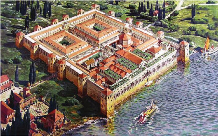
Resim 3. Yak. MS.300 tarihli Diocletianus Split'teki Sarayı (Rekonstrüksiyonu, URL)

A v r u p a ’ d a k i Orta Çağ kentlerinin de piskoposlukların oturduğu yerler ve aynı zamanda birer kale formunda oldukları bilinmektedir. 23 Batılı Romalılar bu kentlerini gelen saldırılara karşı korumak için duvarlarla çevirmişlerdir. Müslüman ve İskandinav saldırılarına karşı siper görevi gören yanlarda dizili kuleleriyle surlar, kentleri kapalı alanlara dönüştürmüştür. 9. yüzyılın başında bu yapılar her yerde kale 24 şeklinde yükselmiştir. 25 Orta Bizans Döneminde kentler, kale anlamına gelen kastral er şeklinde tanımlanmıştır. 26 Ayrıca Orta Çağ kentleri, Tüccarların güvenlik gereksinimi nedeniyle, duvarları olan müstahkem yerlere ve “ Kale-Kent ” olarak da belirtilen kasabalara dönüşmüştür. 27 12. yüzyılda kentsel yaşamın sürdüğü tek kentin Konstantinopolis (İstanbul), olduğu ve kültürlü kimselerin burada yaşama arzusunu dile getirdikleri aktarılmaktadır. 28 Anadolu’da özellikle 13. yüzyıldan sonra Selçuklular, Bizans’tan devrildikleri bu