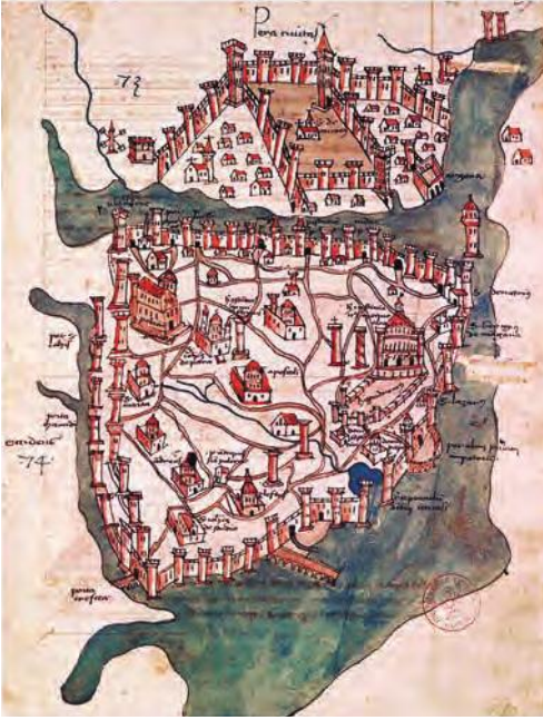
Resim 4. Konstantinopolis Haritası, Liber Insularum Archipelagi , 1422, Floransalı haritacı Cristoforo Buondelmonti, (Atkinson, 2016, s.41.)

kent formunu kullanmaya devam etmişlerdir. 29 Tanyeli (1987) tarafından, Bizans kentlerinin fiziki özelliklerine dayanılarak gruplama yapılmış ve sur duvarı ile çevrili olanlar “Çok-Parçalı Kent” ve “Kale Kent” modeli olarak tanımlanmıştır. 30