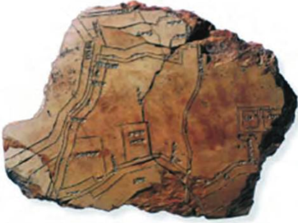
Resim 1. Nippur Kenti Harita Parçası (Atkinson, 2016, s.9)

Kale kent tasarımının el yazmalarındaki formuna geçmeden önce, kale kentlerin tarihsel gelişim sürecine ve bu gelişimi yansıtan görsellere kısaca değinmek faydalı olacaktır. Bilinen ilk kale kent formunun Mezopotamya’da görülmeye başladığı arkeolojik buluntularla ortaya çıkmıştır. Tarihi geçmiş MÖ. 3. bin yıla kadar dayanan, Sümerlerin dini merkezlerinden biri olan Nippur 11 Kenti’ne ait MÖ 1400’lü yıllara tarihlenen kil tabletler üzerine kazınmış şehir planlarının parçaları kazılardan elde edilmiştir. 12 (Res.1). Çivi yazısıyla açıklanmalı ve ölçekli çizilmiş bu parçalar; Dicle ve Fırat Nehirlerinin, bazı konut planlarının, tapınak komplekslerinin ve kent surlarının tasvirini içeren bir şehir planlaması göstermesi bakımından önemlidir.