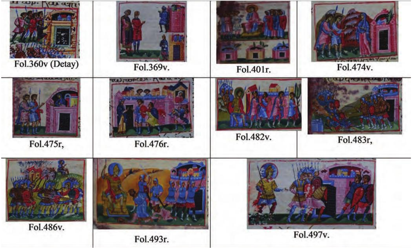
Tablo- Topkapı Sarayı (Gİ8) Oktateukh el yazmasındaki kent tasviri örnekleri, 12. yy.

Antikitenin etkisi devam etmekle birlikte sanat önemli rol oynamaktadır. 53 10., 11. ve 12. yüzyıllara tarihlenen yazmalarda da yine bu kent formu karşımıza çıkmaktadır. Ancak bunlar tarz olarak değişime uğramıştır. Bilindiği üzere, MS.500 dolaylarından sonra sanatçılar 54 gözlem ve araştırma yöntemini terk ederek figürleri kopyalamaya başlamış ve Orta Çağ boyunca bu yöntem devam etmiştir. 55 Böylece Orta Çağda, antikitenin estetiği ve gerçekçilik anlayışı terk edilmiş, imgeler eğitici ve hatırlatıcı birer araç olarak dine hizmet etmeye başlamıştır. 56 Dolayısıyla resim, Hıristiyan sanatında kutsal metnin anlaşılması için kullanılan eğitici fonksiyonu ön planda tutularak oluşturulmuş yansıma birer imge olarak kullanılmıştır. 57 Özellikle çalışmada ele alınan el yazmaları da dini konulu metinler içermekte ve bu bağlamda diğer simge ve semboller gibi kent motifleri de model alınmış kopyaların kopyası olup stylizasyona uğratılmıştır. Bu kopyaların orijinalinde gerçek bir kentten model alındığı ve sonrasında tekrarlanarak devam eden bir motife dönüştüğü için kültürel aktarım sağ □ □ □ □ □ □ □ □ □ □ edir.