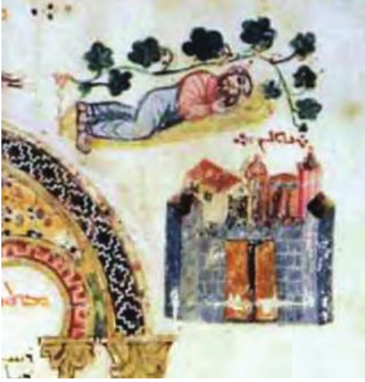
Resim 6. Rabula Dörtlülü İncil, Asma kabağının altında uyuyan Yunus ve Ninova şehri fol.6r. 6. yy, Detay, (Bernabo, 2008, Tablo XI)

Topkapı Sarayı G.İ.8 numaralı Oktateukh 45 el yazmasında geçen hikâyeleri canlandıran resimlerde de kent tasvirine rastlanmaktadır (bkz. Tablo). Söz konusu resimler; kentin kompozisyonundaki konumu