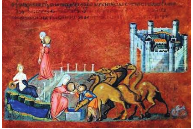
Resim 7. Viyana Genesis el yazması, Rebeka, fol. 7r. 6. yy, (Mazal, 1980'den aktaran Dinçer, 2016, Res.13)