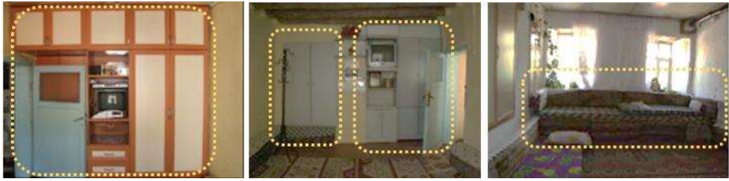
Şekil 3. Geleneksel mobilyanın yerine günümüz mobilyalarının kullanıldığı örnekler (Bekar vd., 2021)

Kırsal alanlarda çevreye yönelik hizmetlerin yalnızca turist odaklı olarak düşünülmesi, insanların kendi çevrelerine yabancılaşmasına neden olur ve insanlar daha çağdaş mobilyalara ilgi duyar. Bunun bir sonucu olarak, geleneksel mobilyalar fabrika ürünü mobilyalara göre daha az tercih edilir. Geleneksel özelliklere sahip bir konutta kullanılan fabrika üretimi mobilyalar Şekil 3'de gösterilmektedir.