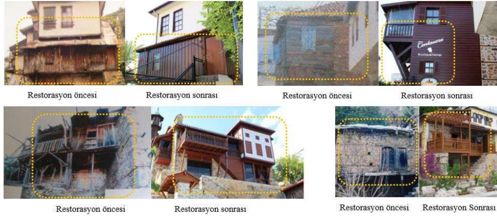
Şekil 1. Cephe restorasyonu örnekleri (Halaç ve Demir, 2017)

Cephelerde kaplama yönünün değiştirilmesi, kaplama boyutlarının değiştirilmesi, cephedeki doluluk boşluk oranlarına sadık kalınmaması, kaplama konumlarının değiştirilmesi, özgün halinde mevcut olan unsurların çıkarılması veya eklenmesi cephenin özgün kimliğine zarar vermektedir. Cephe dokusuna yabancı çıkmalar, modern ısıtma çözümleri olan klima dış üniteleri ve tabelalar da cephe kimliğine zarar veren diğer unsurlar arasında gösterilebilir.