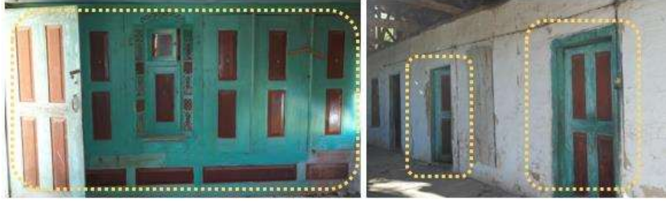
Şekil 4. Boyanarak kullanılan iç mekan öğelerine örnekler (Bekar vd., 2021)