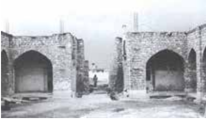
Fotoğraf 4 Hângâhın avlu duvarları, Hângâh ve Aramâh-ı Çelebioğlu, s.43