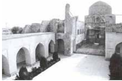
Fotoğraf 2 a Sultaniye Külliye Avlu Yönünde Türbenin karar yeri, Hângâh ve Aramâh-ı Çelebioğlu, s.23