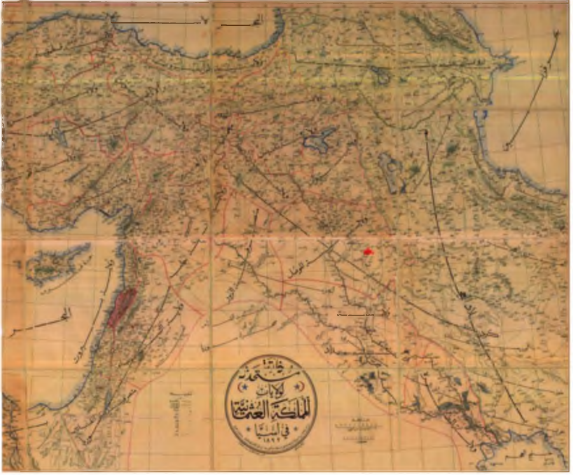
Osmanlı Devleti'nin Ortadoğu'daki topraklarını gösteren harita, haritanın tam ortasında كردستان (Kürdistan) kelimesi bulunmaktadır. (Kürdoloji Çalışma Grubu, Osmanlı Kürdistanı, bgst Yayınları, İstanbul, 2011, s. Kapak Sayfası)