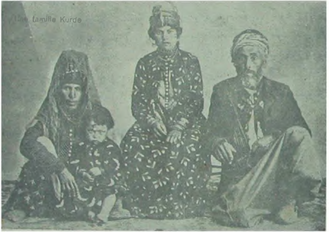
Şam'da Milliyetini Muhafaza Eden Kürdlerden Bir Aile

3Muharremu'l-Haram Sene 1332 Şimdilik Ayda Bir Neşrolunur 21 Teşrîn-i Sani Sene1329