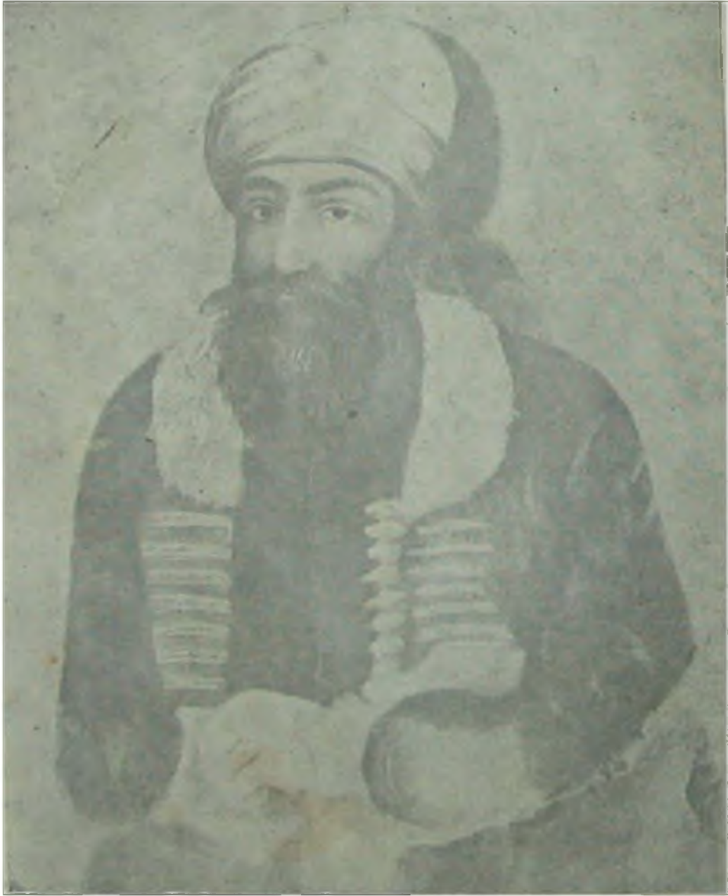
Bâbân Ümerâsından Abdurrahman Paşa

23 Zilka'de Sene 1331 Şimdilik Ayda Bir Neşrolunur 11 Teşrin-i Evvel Sene 1329