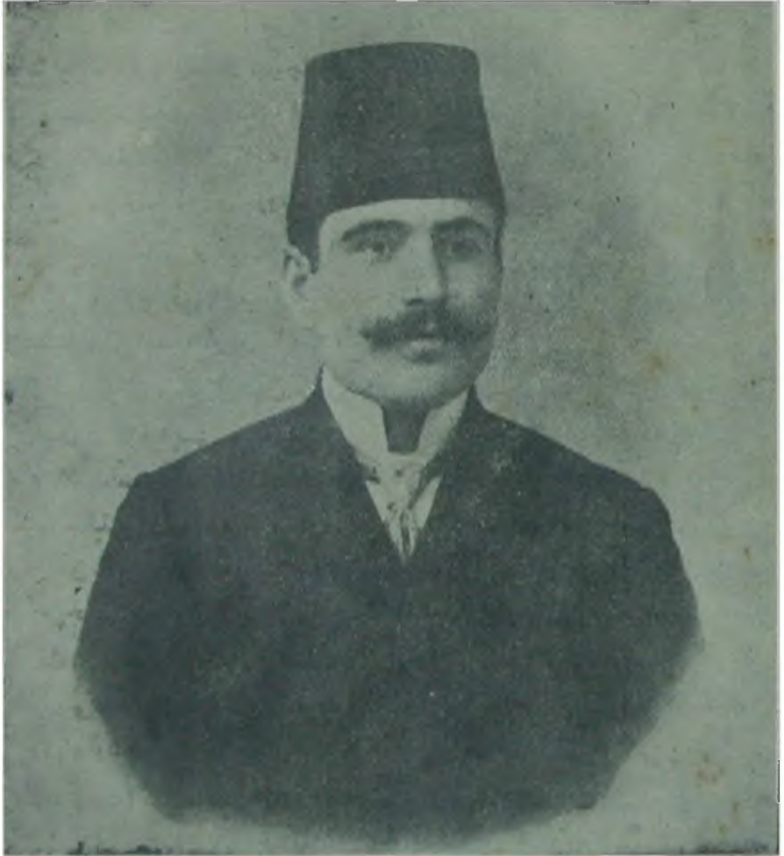
Merhum Bâbânzâde İsmâil Hakkı Bey

13 Safer'ul Hayr Sene 1332 Şimdilik Ayda Bir Neşrolunur 29 Kanuni Evvel Sene 1329