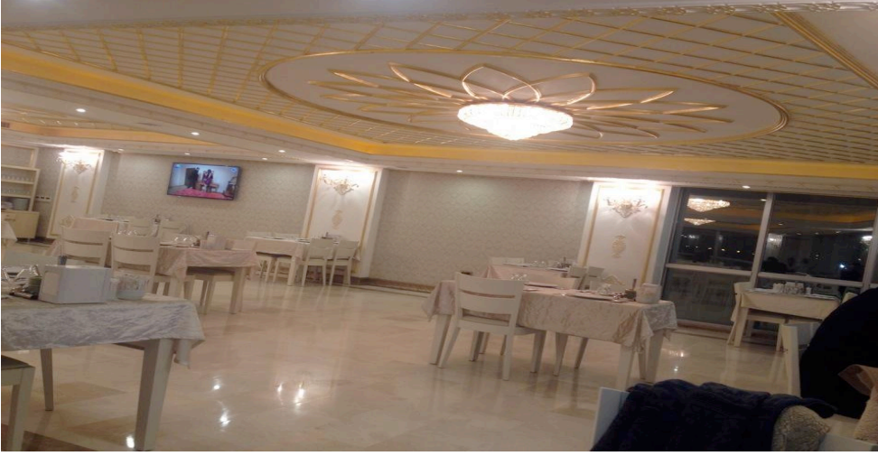
Resim 5-6: Künefeci Levent Usta'nın Yeri

Aynı durum ev mimarisinde de görülmektedir. Lüks evlerin iç dekorasyonunda altın rengi sık kullanılmakta, hatta bu evlerin pazarlanmasında da altın imgesinin kullanıldığı görülmektedir. Adeta altının kışkırtıcı gücünden yararlanılarak lüks, zenginlik ve güç kavramlarını sarmalayan bir yaşam biçimine göndermede bulunmaktadır (Zeybek, 2013: 118). Örneğin, Diyarbakır'da 75 Metre'de yapılan Golden Line sitesinin hem site isminde hem de broşüründe bulunan külçe altın anahtarlık zenginliğe, lükse, ihtişama ve değerli bir yatırıma işaret etmektedir.