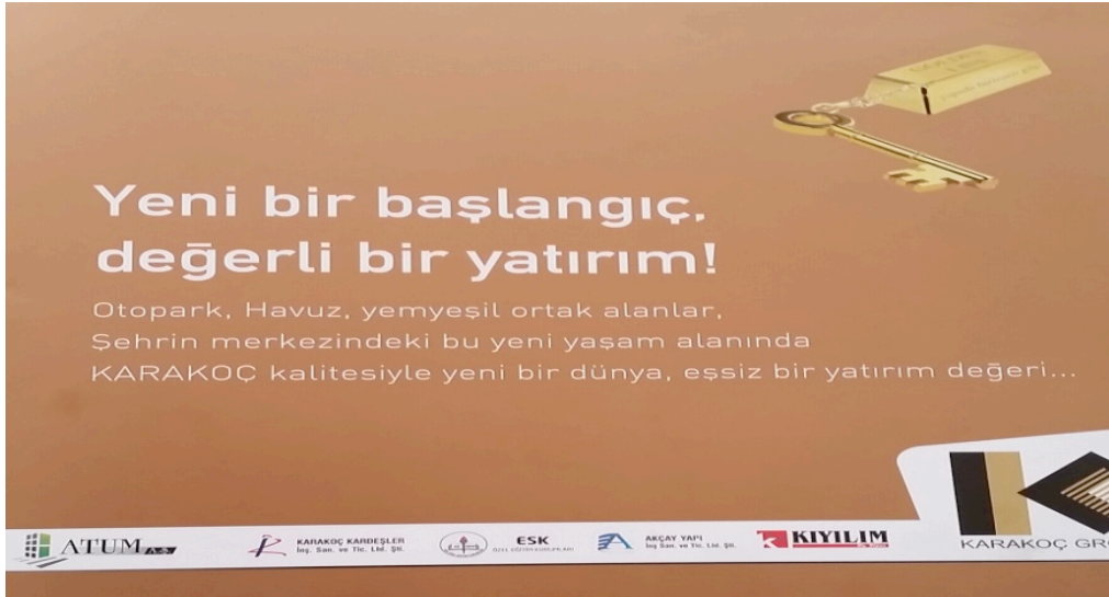
Resim 7: Golden Line Sitesi Tanıtım Broşürü

Aynı durum ev mimarisinde de görülmektedir. Lüks evlerin iç dekorasyonunda altın rengi sık kullanılmakta, hatta bu evlerin pazarlanmasında da altın imgesinin kullanıldığı görülmektedir. Adeta altının kışkırtıcı gücünden yararlanılarak lüks, zenginlik ve güç kavramlarını sarmalayan bir yaşam biçimine göndermede bulunmaktadır (Zeybek, 2013: 118). Örneğin, Diyarbakır'da 75 Metre'de yapılan Golden Line sitesinin hem site isminde hem de broşüründe bulunan külçe altın anahtarlık zenginliğe, lükse, ihtişama ve değerli bir yatırıma işaret etmektedir.