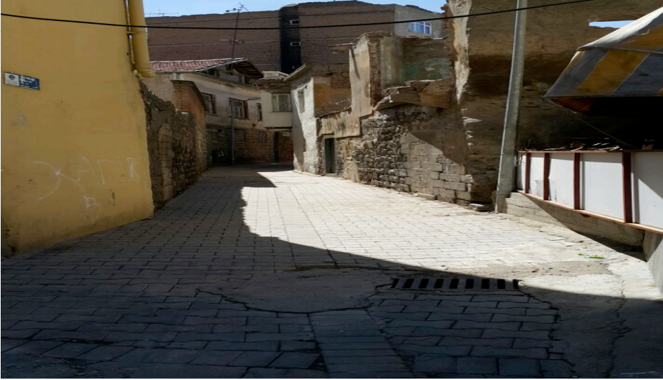
Resim 3: Suriçi’nde Dar Sokaklar

Amed (2014), “ Amed’de Yoksulluk Haritası Burjuvalar ve Yoksullar ” adlı yazısında yoksulluk, can pazarı, sefalet ve açlığın kol gezdiği Bağlar, Suriçi, Şehitlik, Ben-u Sen, Alipaşa, Mardinkapı, Aziziye, Seyrantepe, Fiskaya, Fatihpaşa, İskenderpaşa, Melikahmet, Saraykapı, Yenikapı, Balıkçılarbaşı, Çifhavuzlar, Yanikköşk, Yeniköy ve onlarca mahalleyi kentin gerçek yüzü olarak tanımlamaktadır. Bu mahallelerin burjuvazi tarafından ötekileştirildiğine değinen Amed, buralarda geçim kaynağının neredeyse hırsızlık ve uyuşturucu satışı üzerinden geliştiğini belirtmektedir.