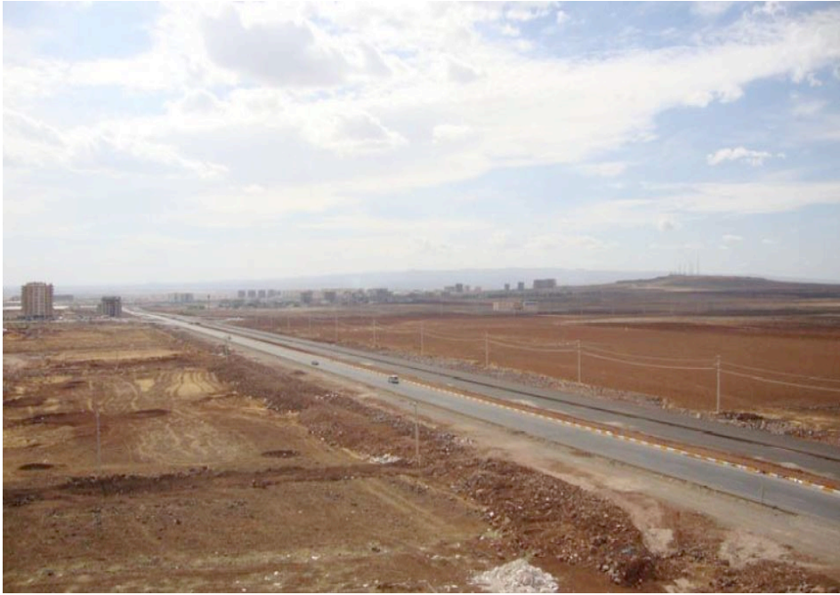
Resim 10: 75 Metre 2010 Yılında Boş Bir Araziyken (Kaynak: Coşgun, 2013: 90).

Genelde bu mahalle denince Diclekent, durumu iyi olanlar geçiyordu. Yani hali vakti yerinde olan insanlar, durumu müsait olan insanlar gelip buraya yerleşiyordu. Şimdi hemen hemen orta hale dönüştü. Çünkü 75'in üzeri daha iyi. Oraya taşınıyorlar (Erkek, 39, Kapıcı).