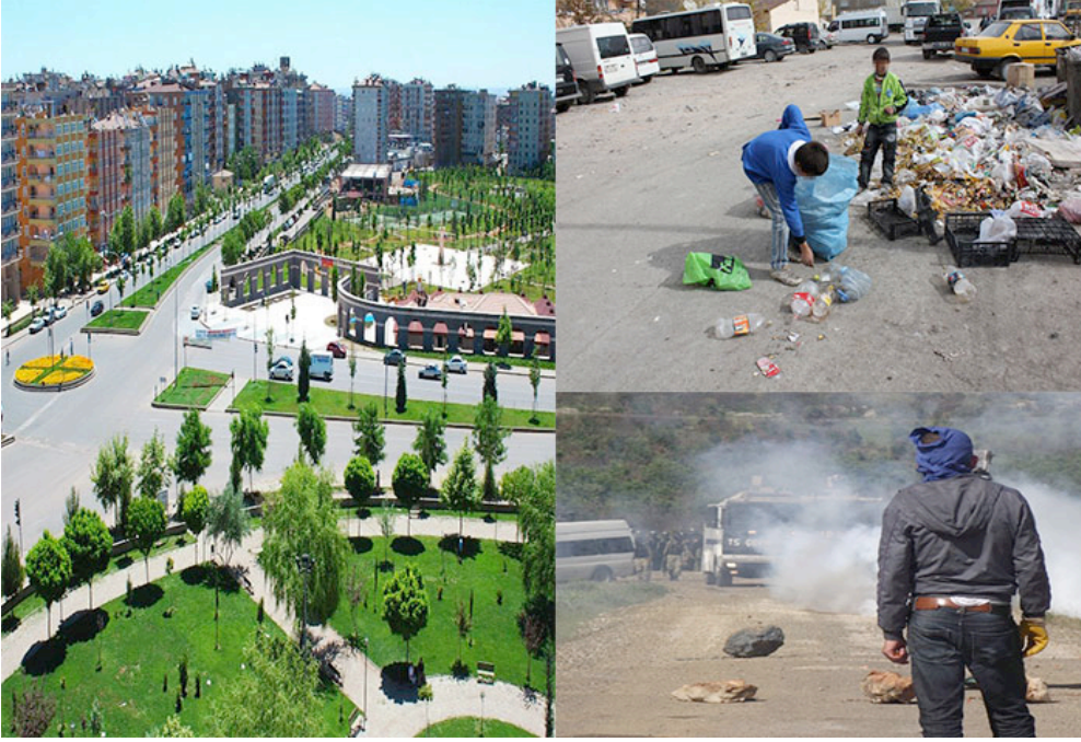
Resim 1: Diyarbakır'ın İki Yüzü 1

Görüldüğü gibi Diyarbakır kenti genel olarak katılımcıların zihninde tezatlıklarla şekillenen bir algıya dönüşmektedir. Geleneksel ve modern olanı bir arada barındıran kentte, kentsel yoksulluk ve zenginlik de en yoğun şekilde tecrübe edilmektedir. Diyarbakır kimi zihinlerde filmlerde izlenen “Teksas” gibi gelişmemiş ve çağdışı bir yer olarak belirirken kimi zihinlerde de “Paris” gibi modernliğin ve lüksün merkezi olarak billurlaşmaktadır.