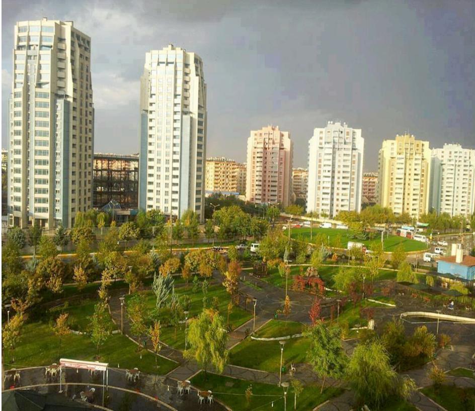
Resim 9: Yeşil Alanlarıyla Diclekent’ten Bir Kare

Biraz daha gelişmiş, biraz daha rahatlık açısından daha şey. Park alanları yeşil alan olarak çok daha fazla. Binalar olarak daha kullanışlı ve konforlu ( Kadın, 42, Sözleşmeli Memur).