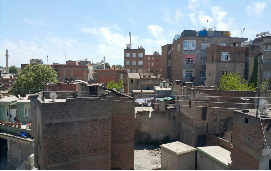
Resim 2: Suriçi’nde Sıkışık Ev Yapıları

şehre gelenlerin şöyle bir uğrayıp, ilk fırsatta şehrin daha iyi yerlerine kaçtıkları bir uğrak-semttir (Atlı, 2014b: 92-97). Ayrıca göç mağdurlarının şehre adapte olmaya çalıştıkları, göçün psikolojik ve toplumsal sonuçlarının ilk görüldüğü alandır.