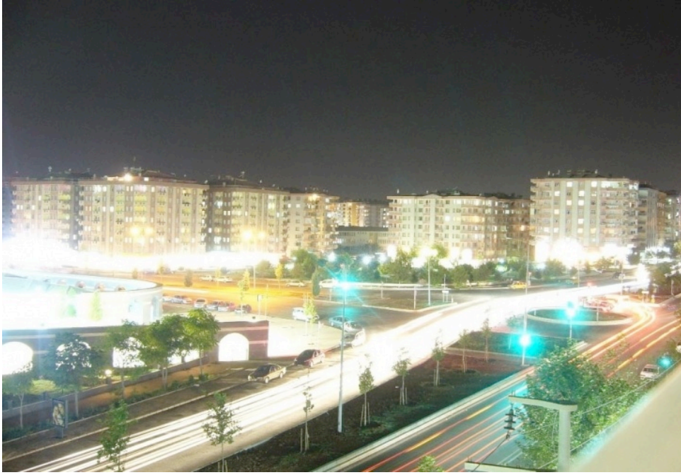
Resim 4: Diclekent Bulvarından Bir Kare

Katılımcıların gittiği restoran ve kafelere baktığımızda ise lüks ve ihtişamlı tasarlanmış mekânsal özelliklere sahip oldukları görülmektedir. Altın varaklı işlemler, devasa avizeler ve ışıklı aksesuarlar bu mekânların vazgeçilmez tasarımlarındandır. Bu durum ise altın renginin zenginliğin, lüksün, seçkinliğin ve soyluluğun rengi olarak algılanmasından kaynaklanmaktadır. Altın sarısı, güce ve paraya da gönderme yaparak değer ve statü göstergesi olarak görülmektedir (Zeybek, 2013: 116).