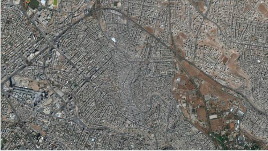
Harita 1: Jabal al-Husseini mülteci kampı/Amman

Amman’daki kampların konumundan dolayı elde ettikleri “ayrıcılıklar”, diğer kamplara kıyasla oldukça gözle görülebilir bir olgudur. Son on yılda, kentsel planlama, rehabilitasyon çalışmaları, alt ve üst yapı inşaları, konutların iyileştirilmeleri, başka bir ifadeyle hem devlet eliyle hem de sivil toplum kuruluşlarının girift ilişki ağları örüntüsünde hazırlanan “fiziksel değişim” planlarının merkezinde Filistin kampları da yer alıyor. Ürdün’ün kentsel imarı ve inşası, bu kampların dönüşümüyle paralel bir duruma doğru evriliyor aslında. Başkent varoş mahallelerinin iyileştirme çalışmaları ile kamplara yönelik fiziksel müdahaleler, eş güdümlü, eş zamanlı ve eş anlamlı bir durumu vâz eder niteliktedir.