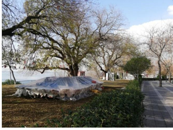
Fot. 1 : ay bahesi, Moda