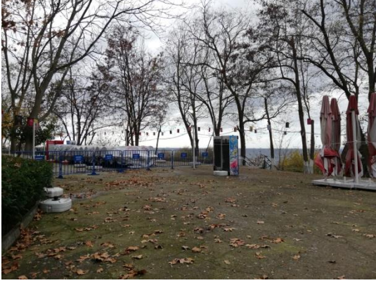
Photo1:Tea Garden, Moda