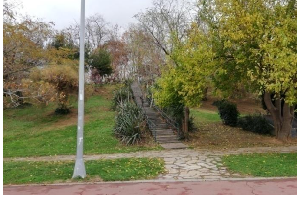
Fot. 2-3: ay bahesinin iinden geilerek ulařılan ve Moda ile Moda sahil yolu arasında baėlantı saėlayan merdiven 3