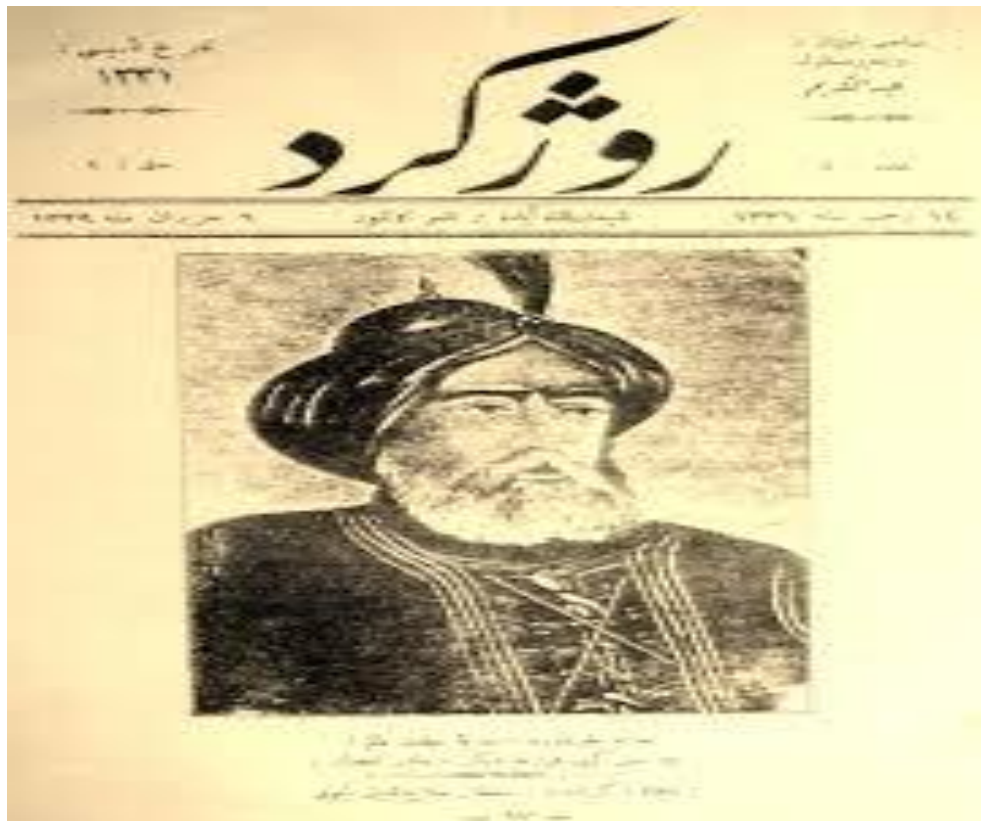
KOVARA ROJÎ KURD