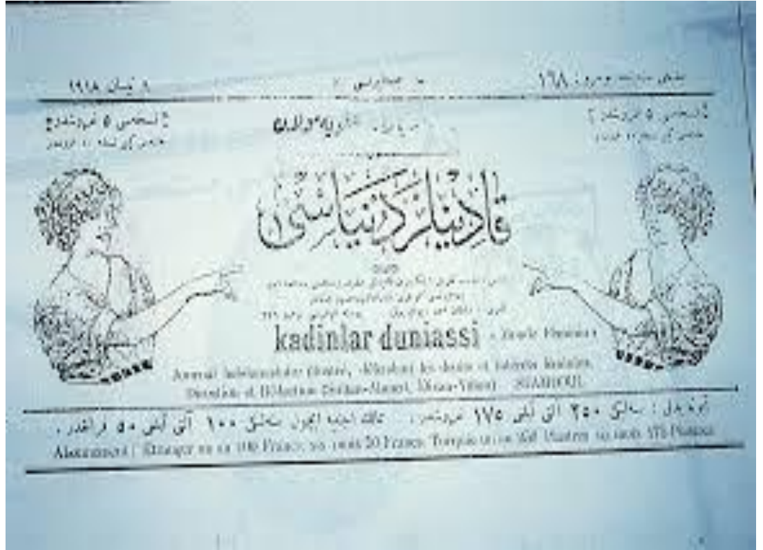
KOVARA ‘KADINLAR DÜNYASI’ RA YEW FOTOXRAF