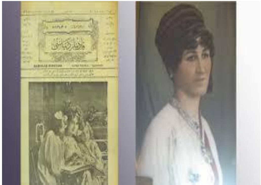
ÛLWÎYE MEWLANE Û KOVARA ‘KADINLAR DÜNYASI’