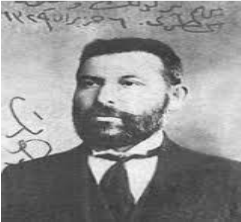
DR. ABDULLAH CEWDET