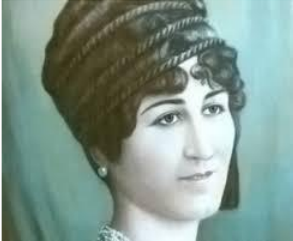
ÛLWÎYE MEWLANE (CÎNÎYÊ RIFAT MEWLANÎ YA)