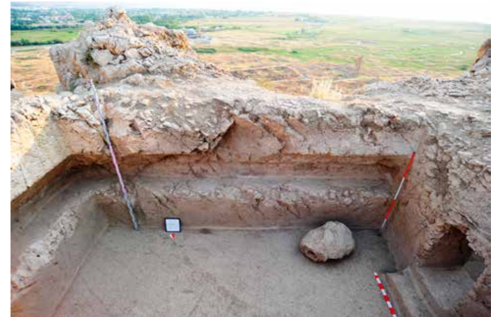
Fig. 4: Ana odanın duvarları boyunca uzanan niş