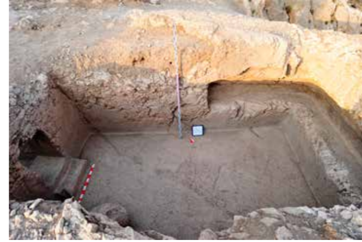
Fig. 7: Ana odaya açılan kapı yapısı ve mil yatağı