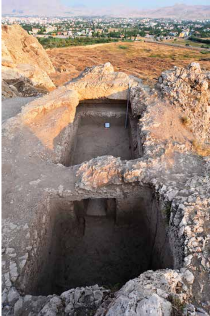
Fig. 6: Kaya mezarının giriş bölümü ve arka odası