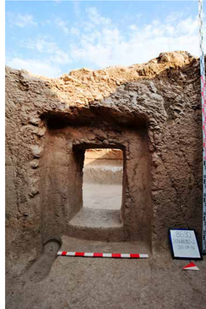
Fig. 8: Ana odanın doğu ve kuzey nişi