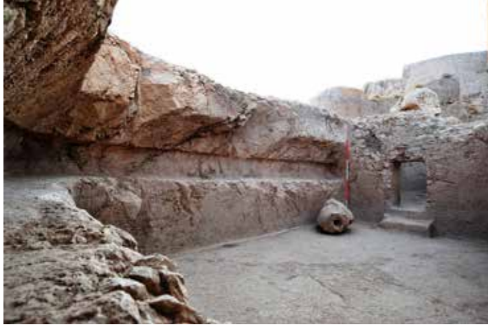
Fig. 5: Mezar odasının duvarlarını çevreleyen doğu ve güney nişi ile birlikte odanın iç yapısı