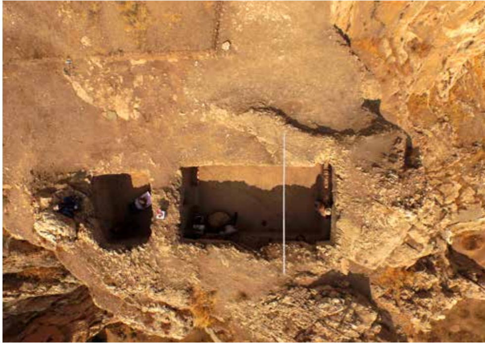
Fig. 2: Dromos ve ana oda ile birlikte mezar odasının üstten görünümü