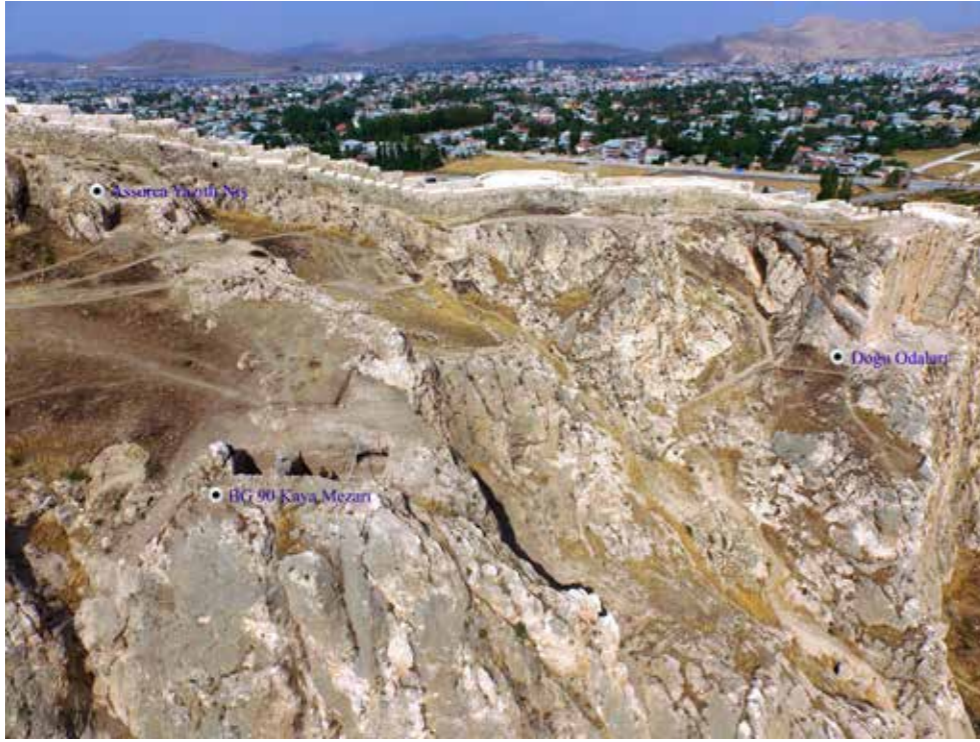
Fig. 1: Kuzeyinde Assurca yazıtlı niş ve doğusunda Doğu Odaları ile birlikte BG 90 Kaya Mezarı'nın konumu