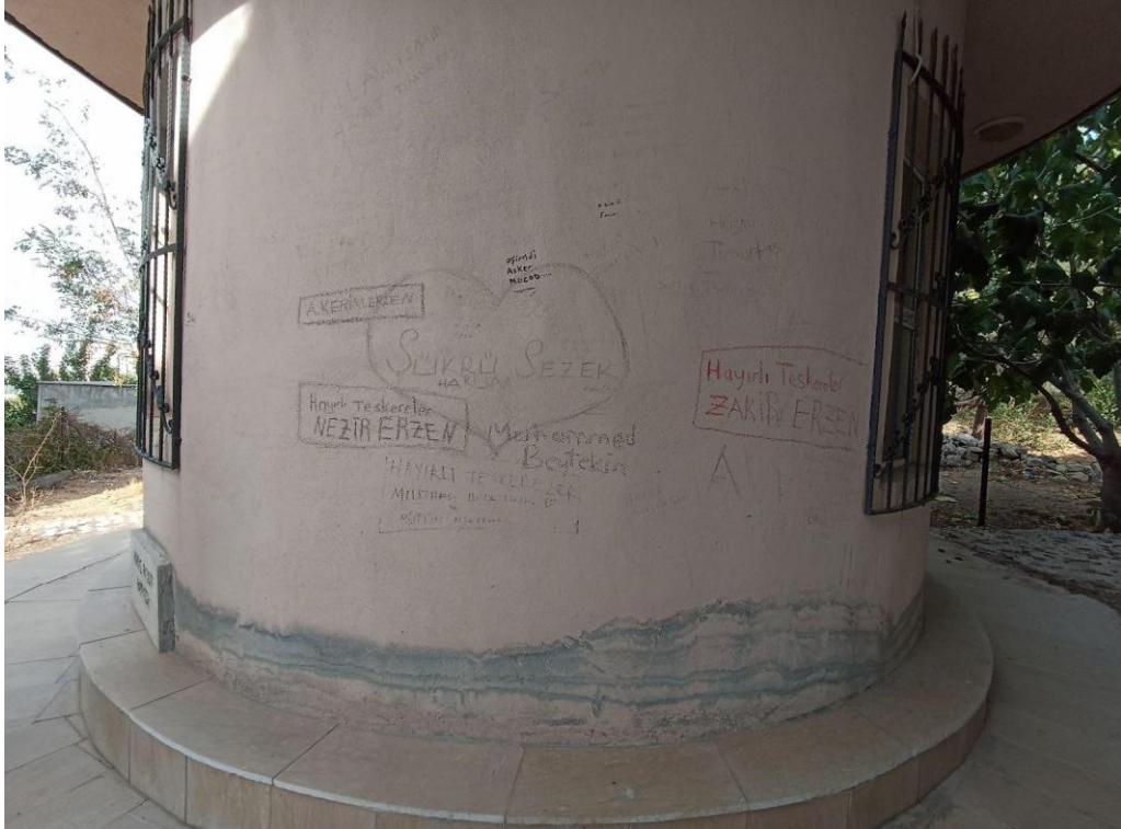
Resim 16. Şeyh Yusuf Garip Türbesi duvarında yer alan yazılar