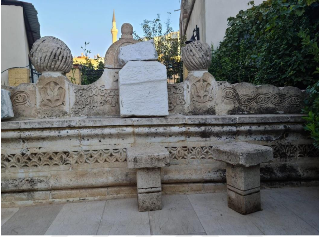
Resim 21. Bel ve sırt ağrılarına iyi geldiğine inanılan yıldırım taşı