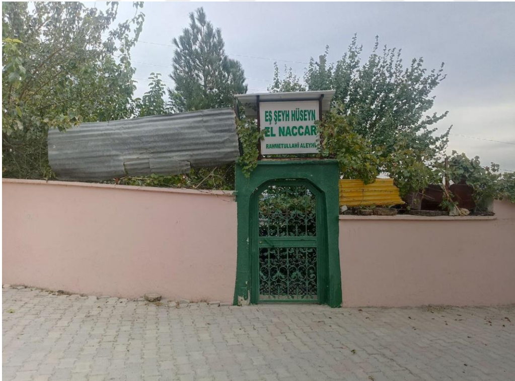
Resim 22. Şeyh Hüseyin El Naccar Türbesi girişi