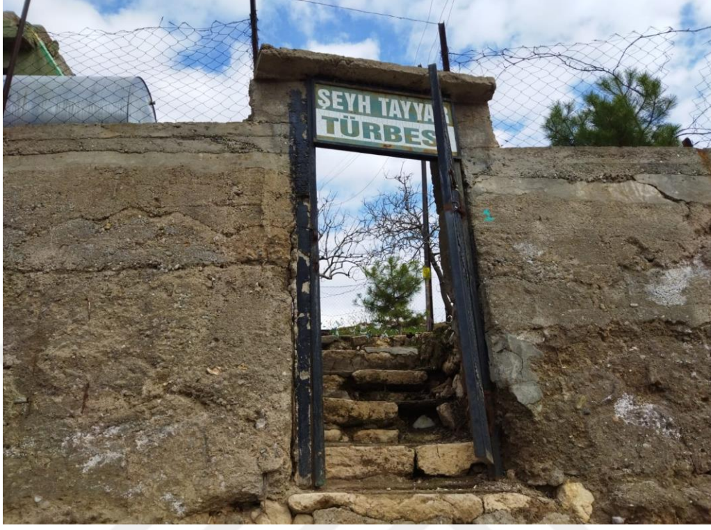
Resim 44. Şeyh Tayyar Türbesinin girişi