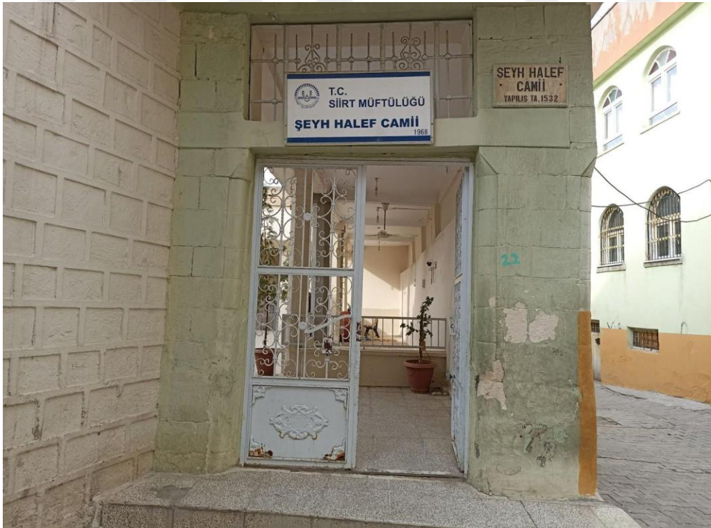
Resim 6. Şeyh Halef Cami ve Türbesi