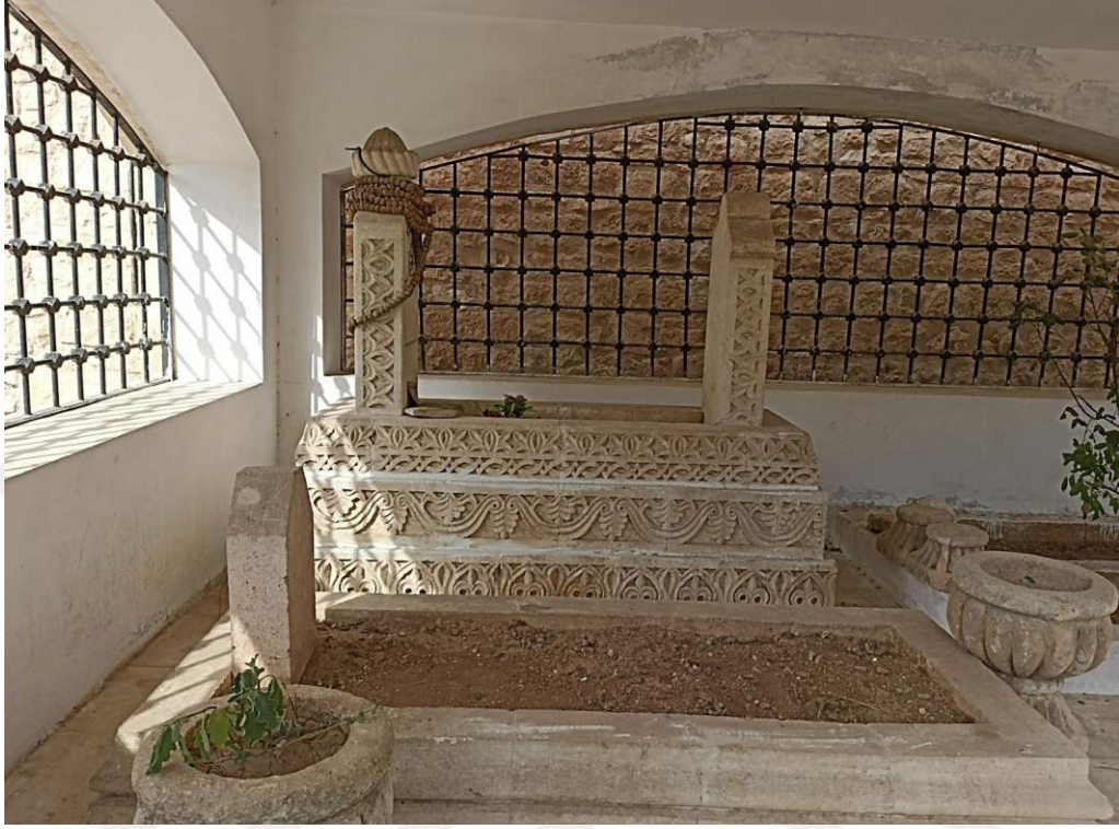
Resim 1. Şeyh Alaameddin Türbesi