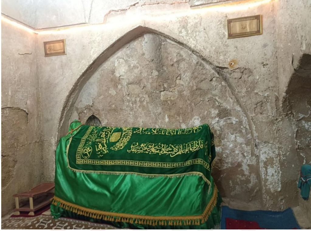
Resim 23. Şeyh Hüseyin El Naccar Türbesi