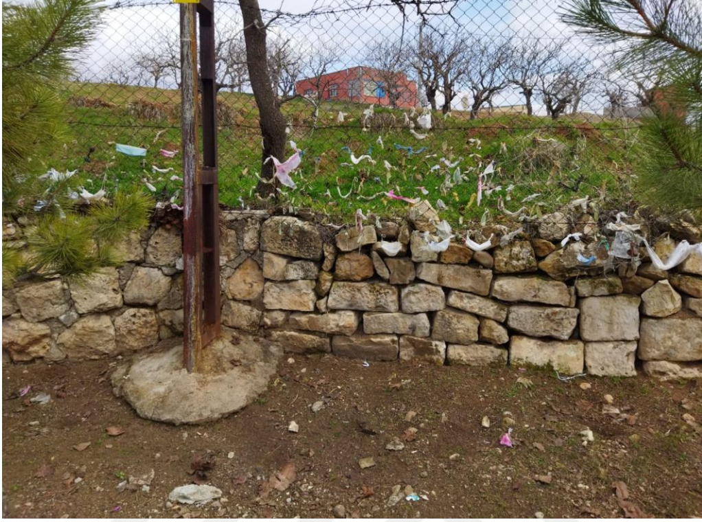
Resim 46. Şeyh Tayyar Türbesi bahçesinde çeşitli dilekler için bağlanan çaputlar