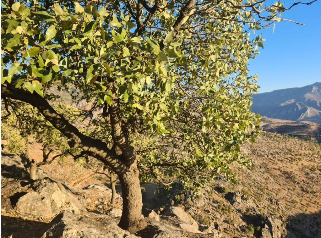
Resim 26. Hayır Ehli Türbesinde yer alan muhtelif hastalıklar için ziyaret edilen taş