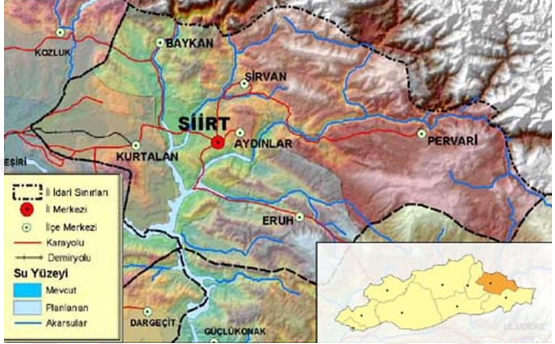
Siirt ili siyasi haritası

kuzeyinde Batman ve Bitlis, batısında Batman, güneyinde ise Mardin ve Şırnak illeriyle çevrili olan bir ildir. Yüz ölçümü 11.519 km iken, Şırnak ve Batman'ın il olmalarından sonra 6186 km 2 'ye düşmüştür (Siirt İl Yıllığı, 1998, 55).