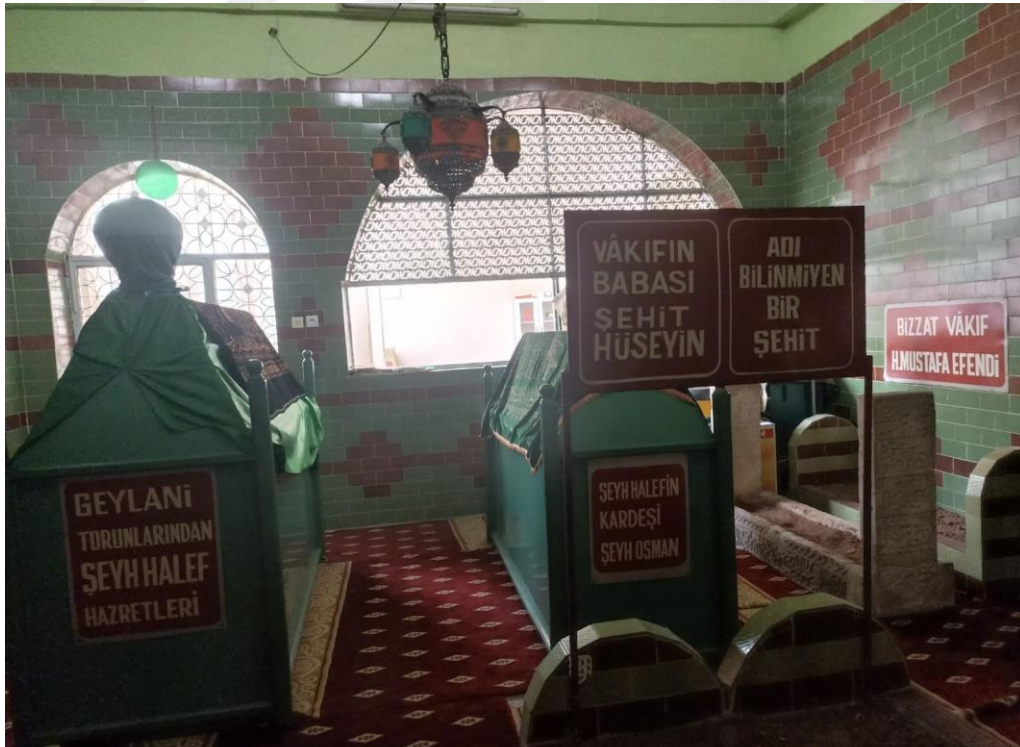
Resim 8. Şeyh Halef Türbesi