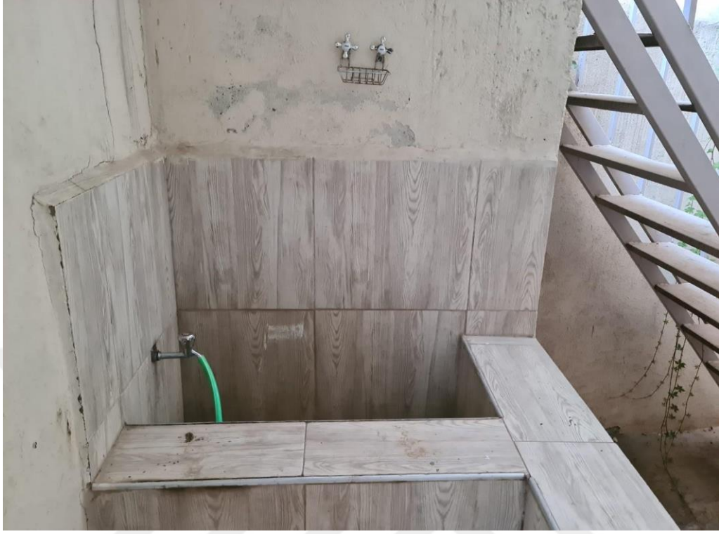
Resim 5. El Fahr Cami içerisinde yer alan şifalı su