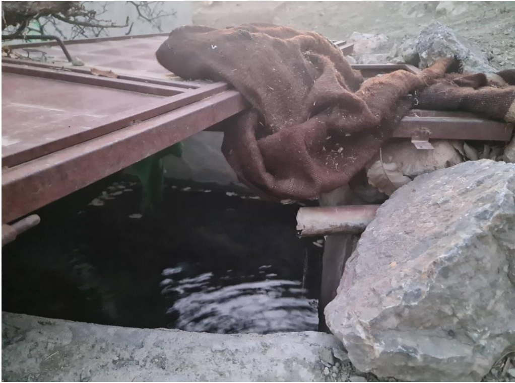
Resim 32. Muhammet Ali şifalı suyunun kaynağı