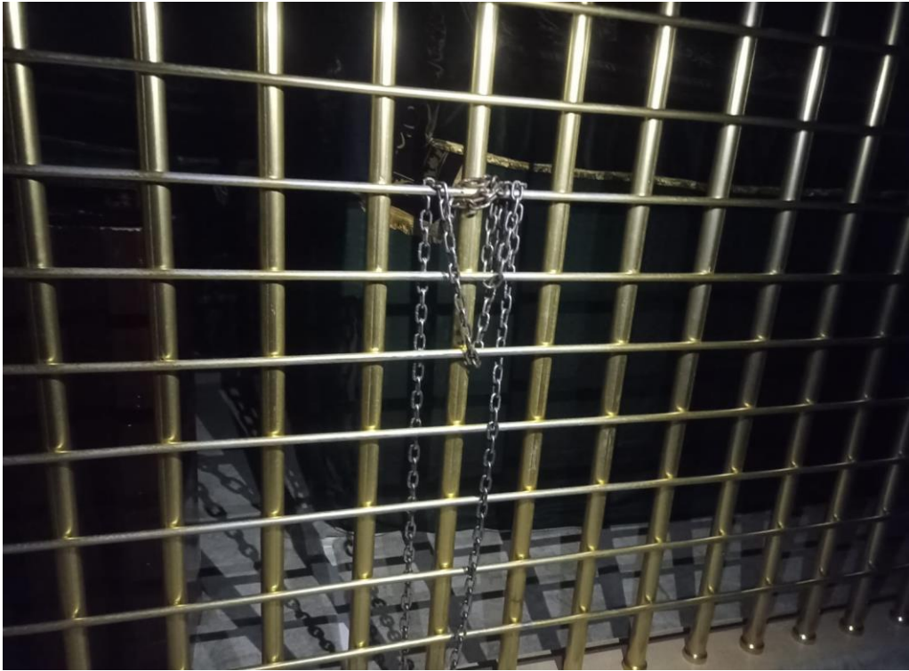
Resim 47. Şeyh Muhammed El-Hazin Türbesinde yer alan psikolojik hastaların ve muhtelif ağrıların tedavisi için kullanılan zincir