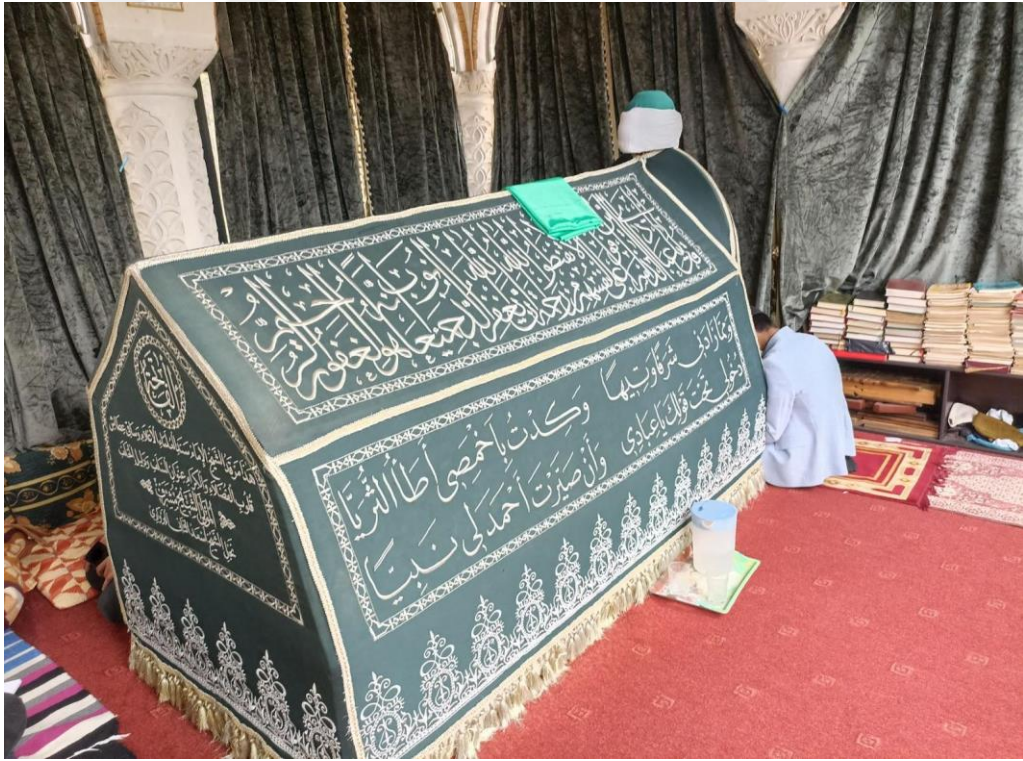
Resim 12. Şeyh Müşerref Türbesi