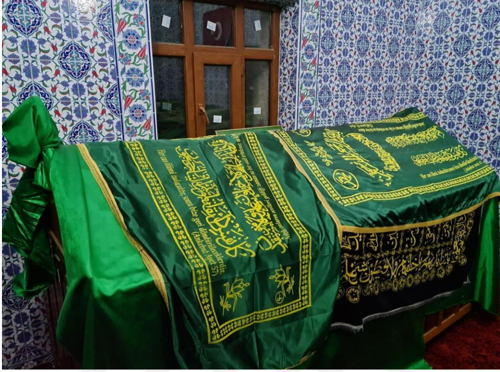
Resim 38. Şeyh Muhammet Türbesi