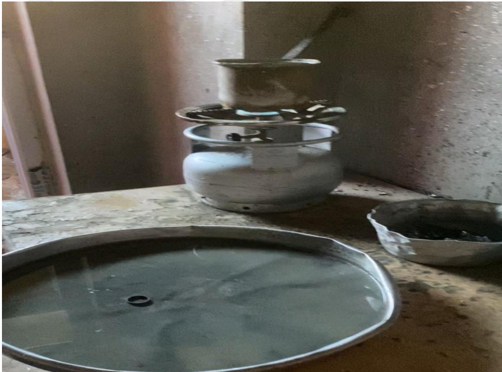
Resim 39. KKŞ1'in kurşun dökerken tepsi içinde kullandığı yüzüğü