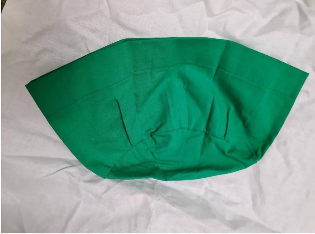
Resim 24. Şeyh Süleyman'ın ağırlar için takkesi