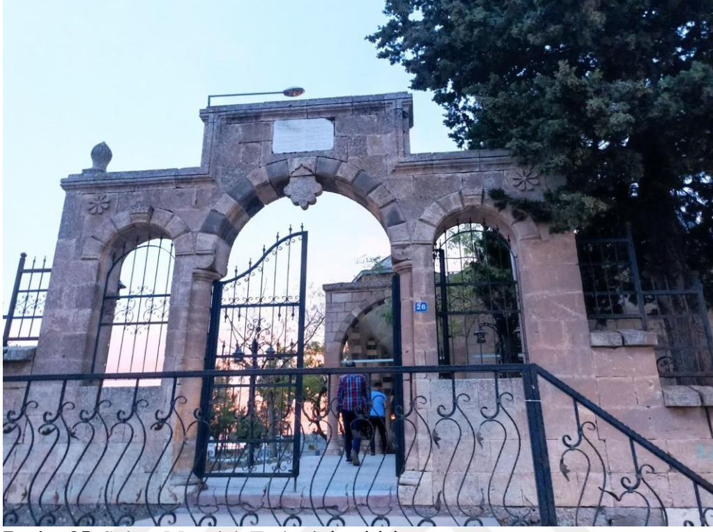
Resim 35. Sultan Memduh Türbesinin girişı