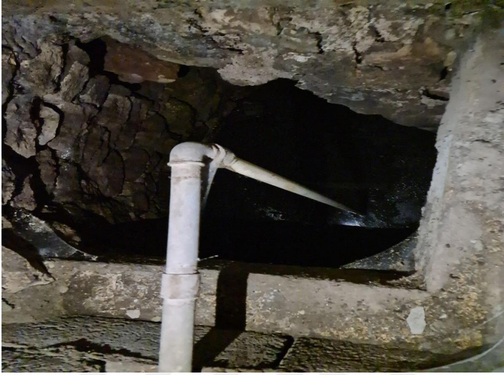
Resim 19. Uvendurra Cami içerisinde yer alan şifalı su