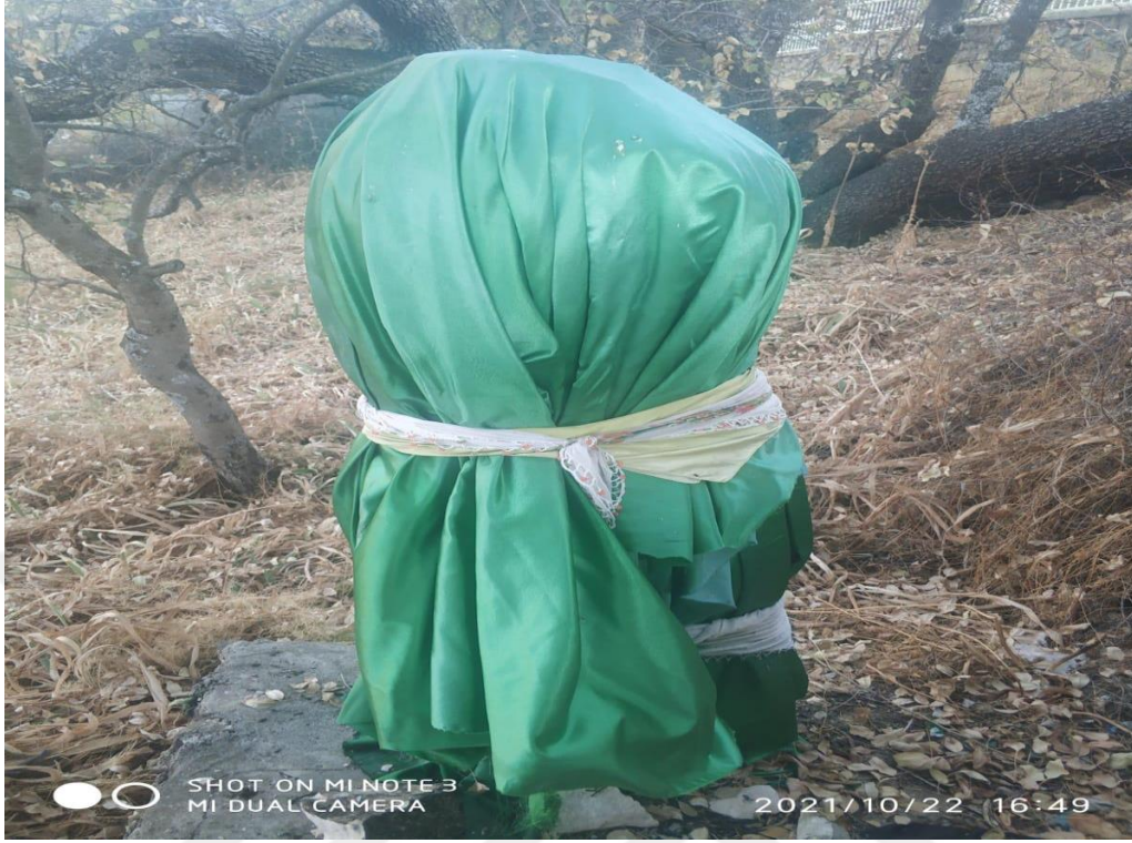
Resim 27. Muhammet Ali Türbesi