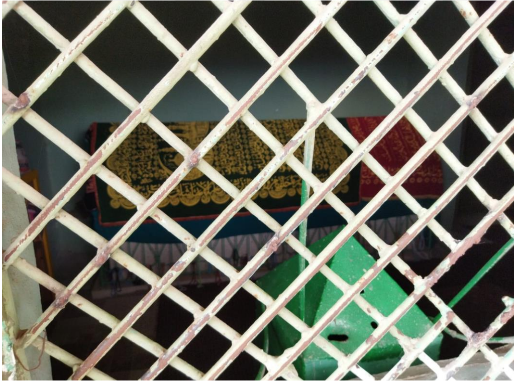
Resim 45. Şeyh Tayyar Türbesi