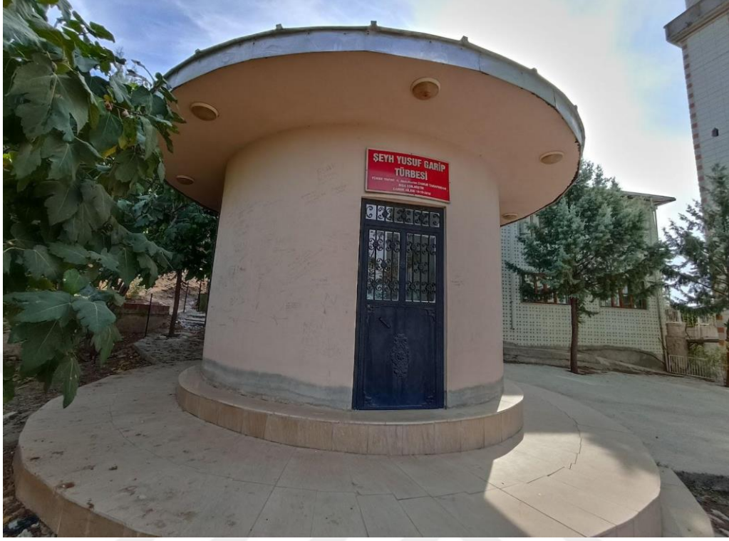
Resim 15. Şeyh Yusuf Garip Türbesinin girişi