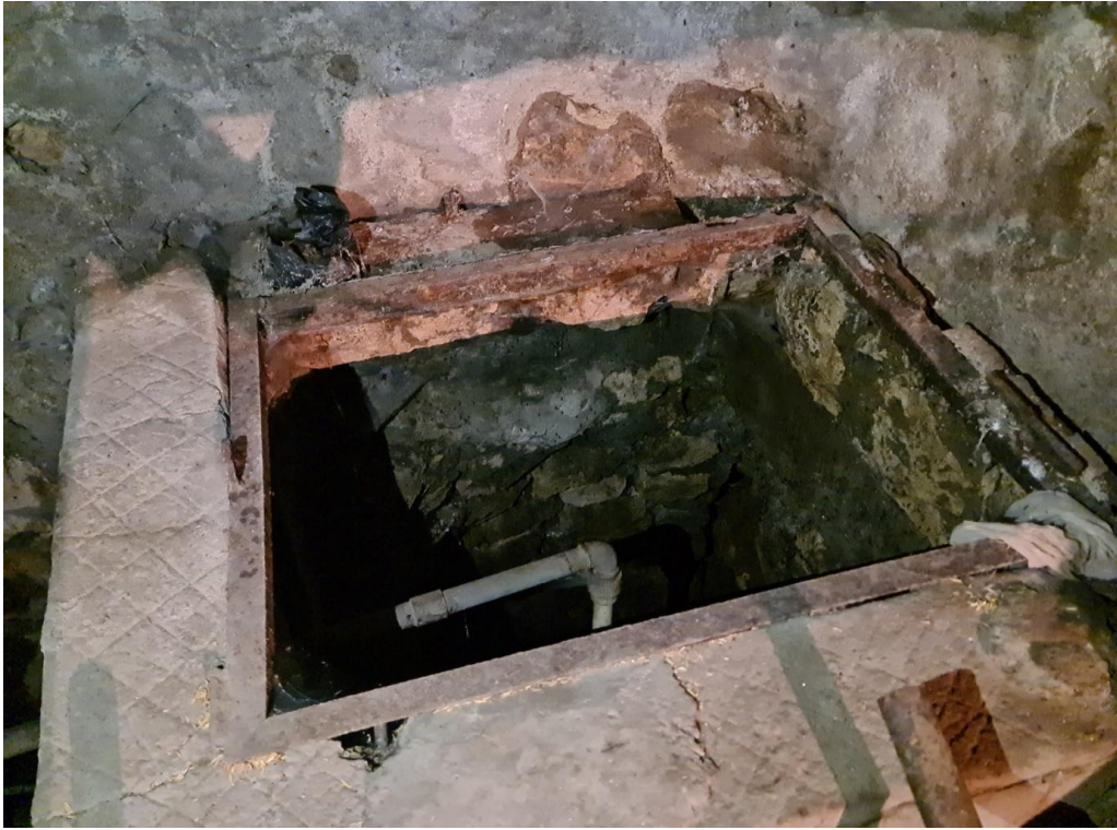
Resim 20. Uvendurra Cami kuyusu (hastaların dilekleri için getirdiği buğdaylar)