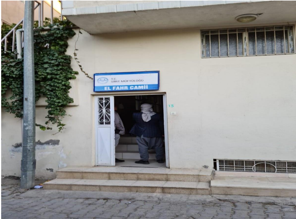
Resim 4. El Fahr Cami