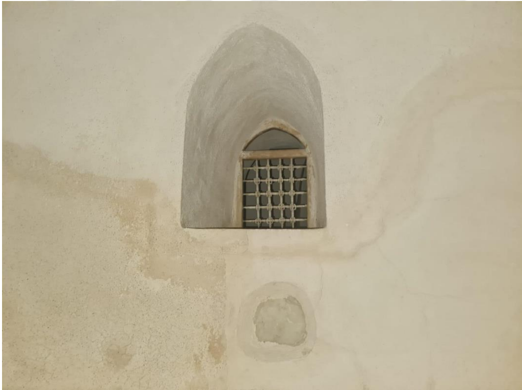
Resim 34. İsmail Fakirullah'ın inzivaya çekildiği, bel ve sırt ağrılarına iyi geldiğine inanılan taş