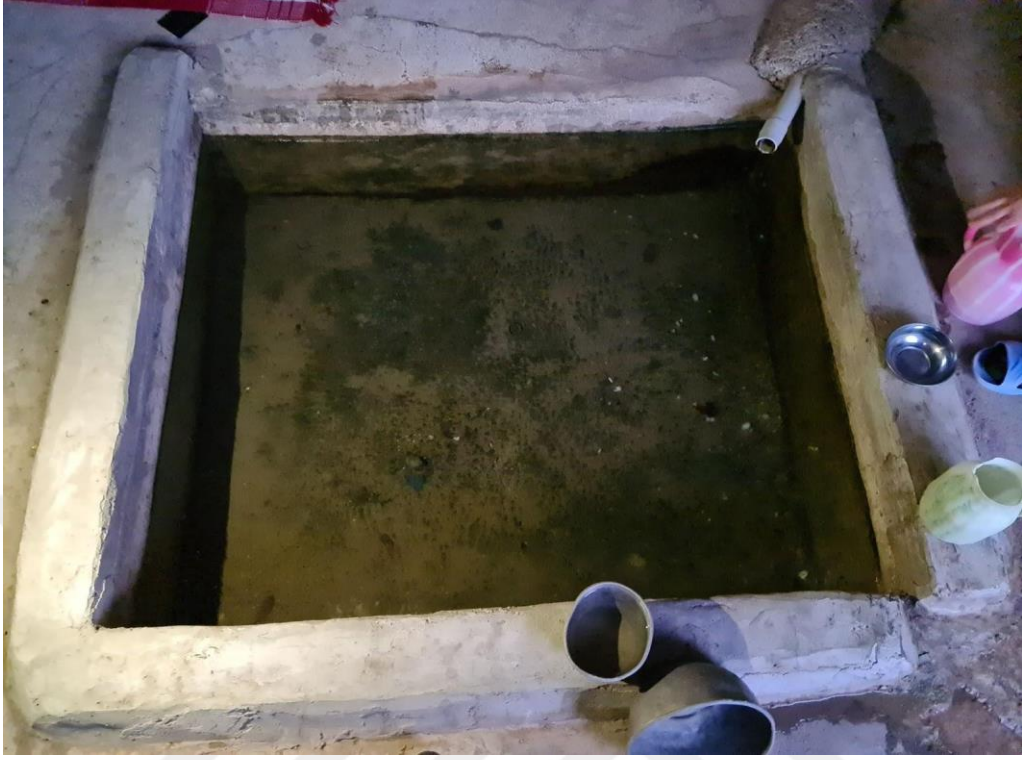
Resim 31. Muhammet Ali şifalı suyunun toplandığı havuz