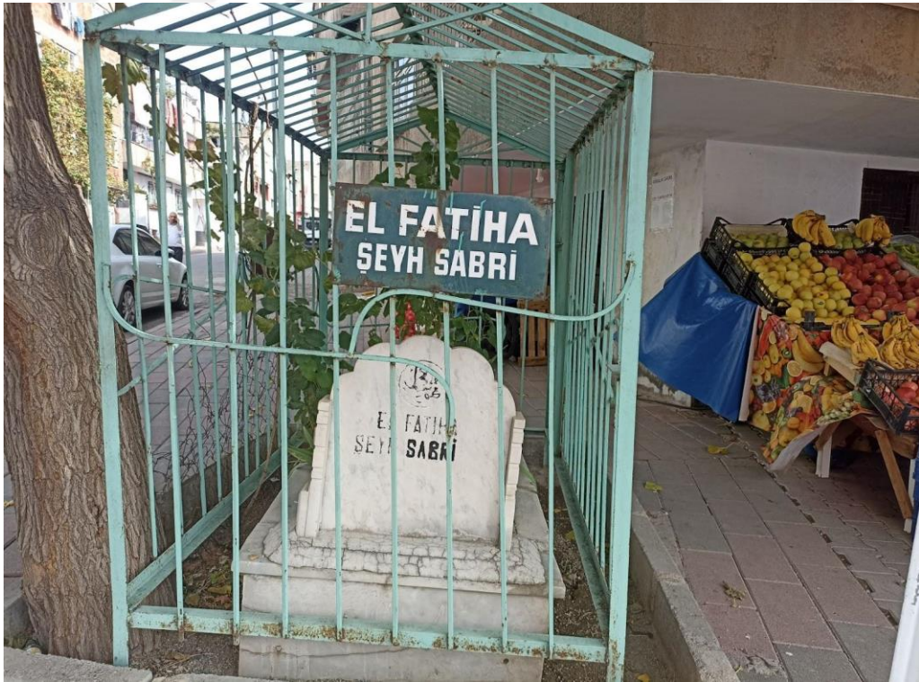
Resim 14. Şeyh Sabri Türbesi