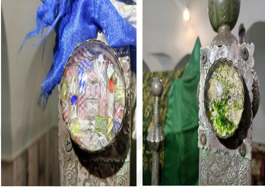
Resim 20.2. Sultan Memduh Türbesi içerisinde bulunan cennet ve cehennem tasvirleri