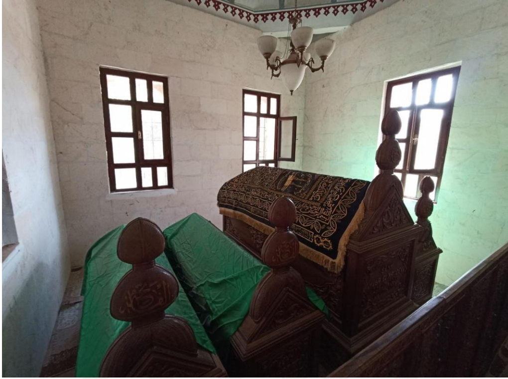
Resim 9. Şeyh Musa Türbesi