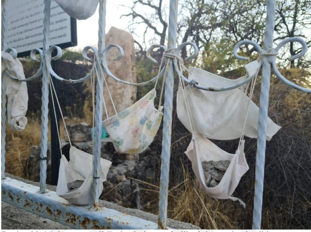
Resim 29. Muhammet Ali Türbesinde çocuk dileğiyle yapılan beşikler