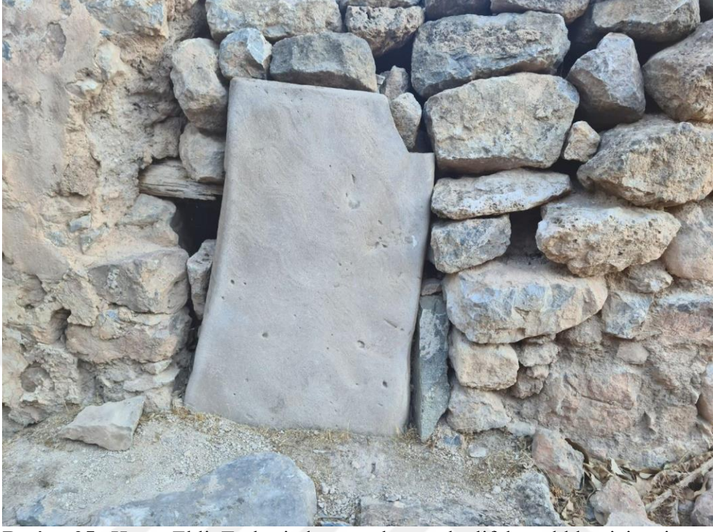
Resim 25. Hayır Ehli Türbesinde yer alan muhtelif hastalıklar için ziyaret edilen taş