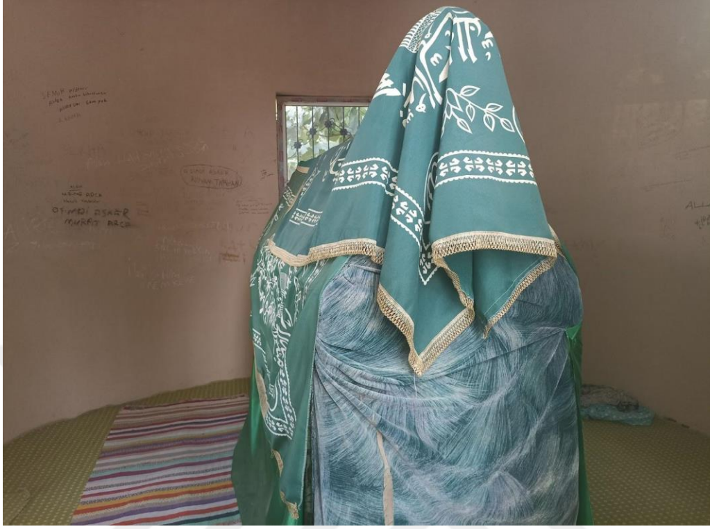
Resim 17. Şeyh Yusuf Garip Türbesi