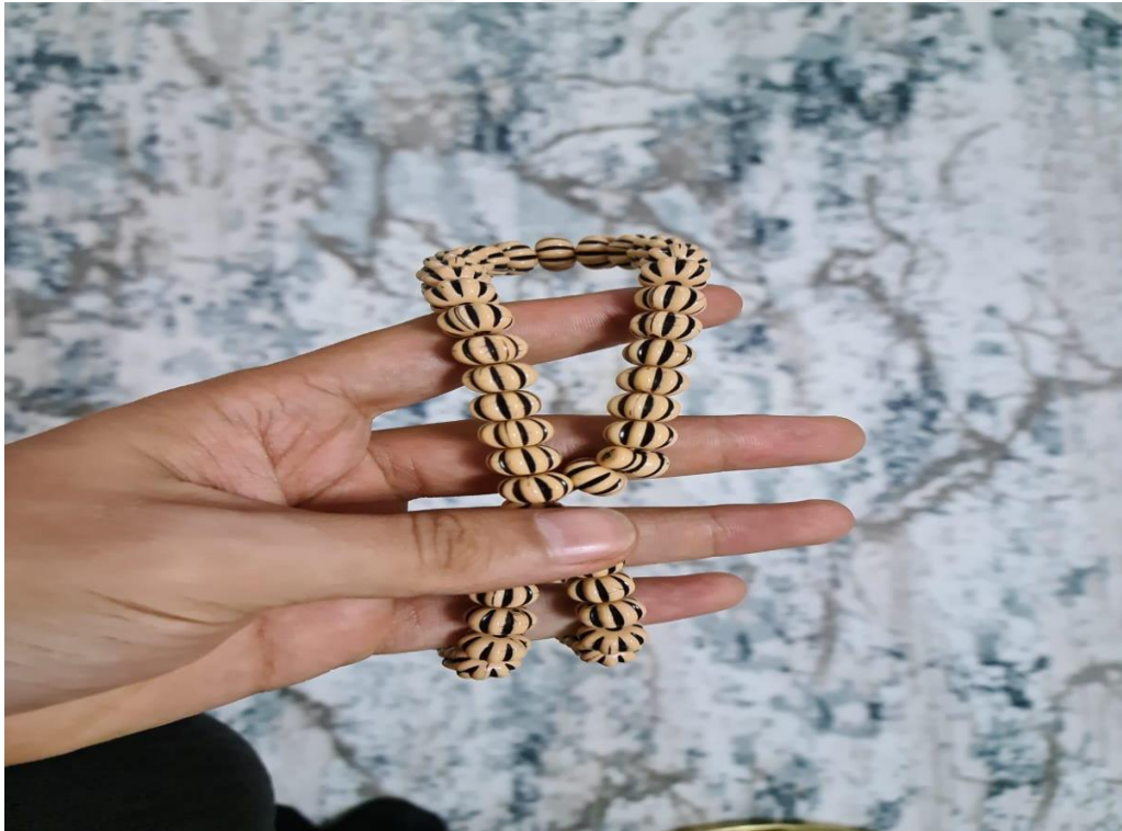
Resim 43. KKŞ2'nin hastalıkların tedavisinde ve muhtelif sıkıntılar için kullandığı tespih