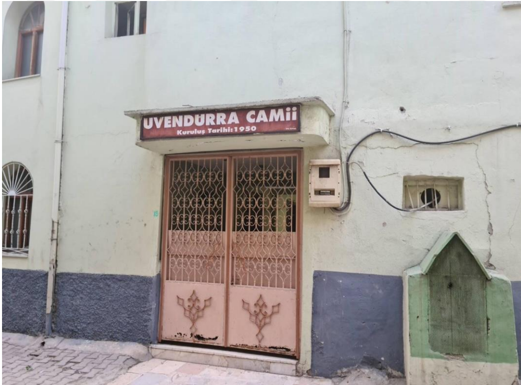
Resim 18. Uvendurra Cami