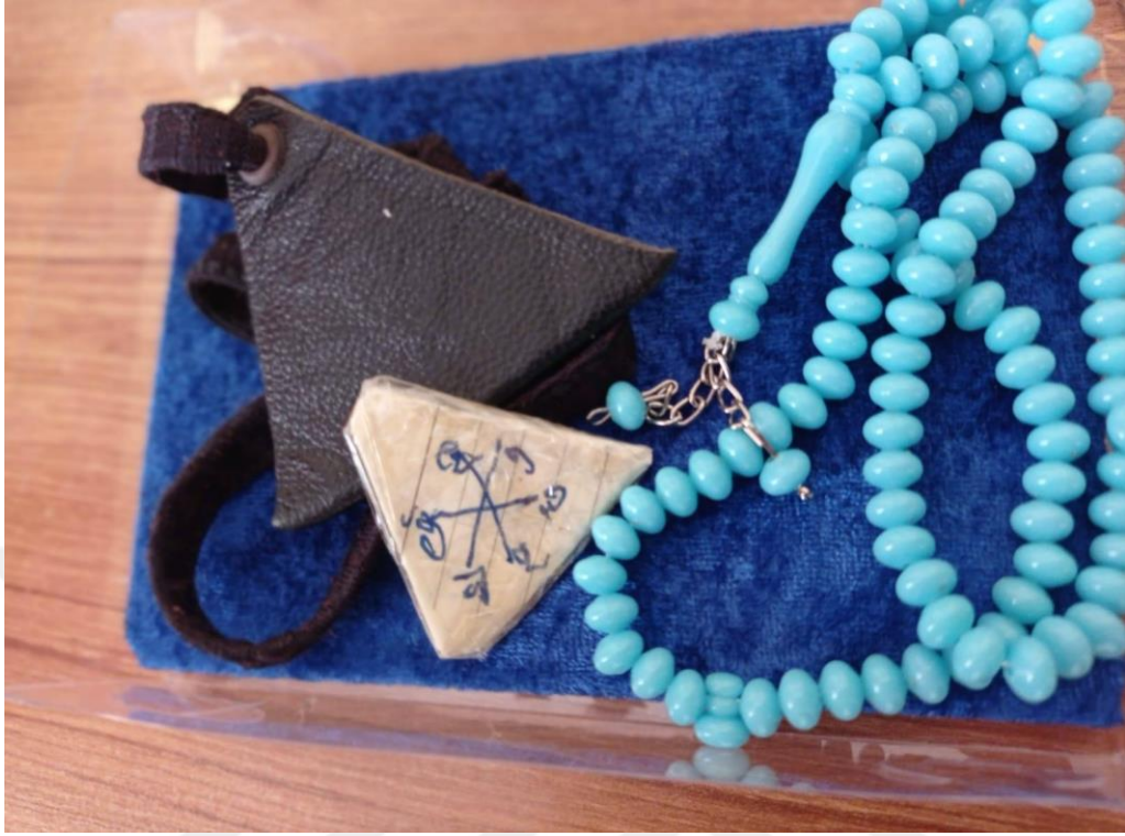
Resim 42. Koruyucu olduğuna inanılan muska