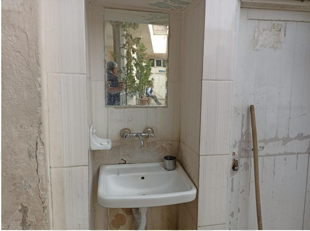
Resim 7. Şeyh Halef Cami ve Türbesi içerisinde yer alan şifalı su