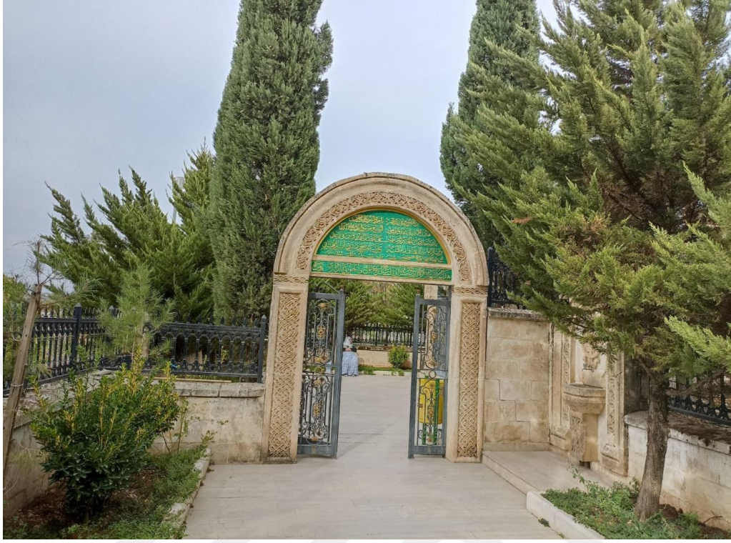
Resim 11. Şeyh Müşerref Türbesinin girişi