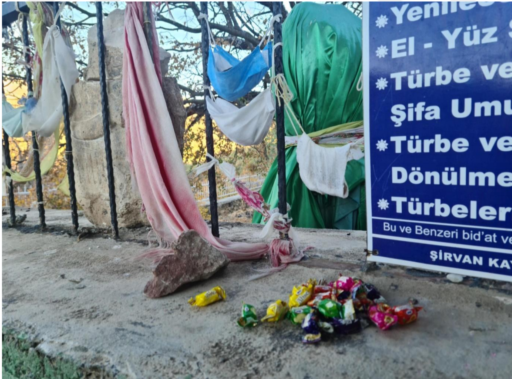
Resim 30. Muhammet Ali Türbesinde ve adak olarak bırakılan şekerler