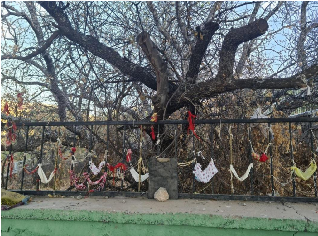
Resim 28. Muhammet Ali Türbesinde çocuk dileğiyle yapılan beşikler