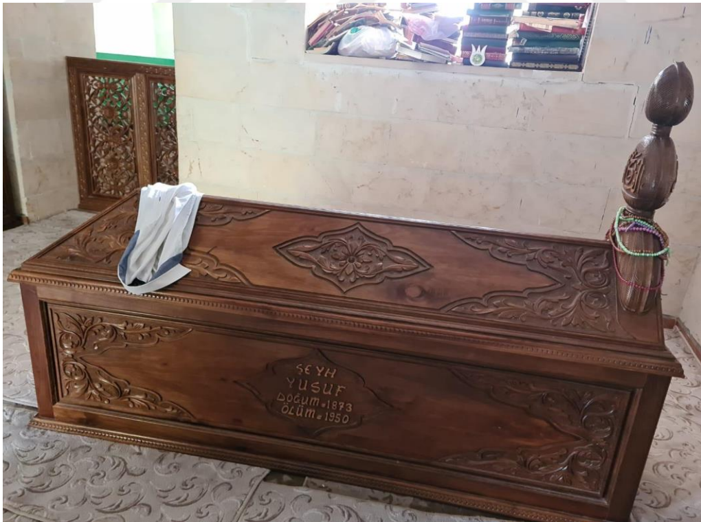
Resim 10. Siirt yöresinde, hastalara ait olan ve şifa amaçlı türbelere bırakılan elbiseler