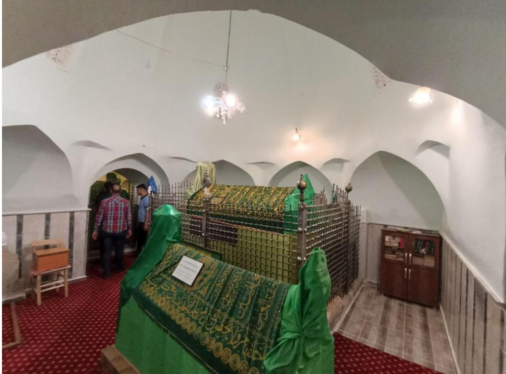
Resim 36. Sultan Memduh Türbesi