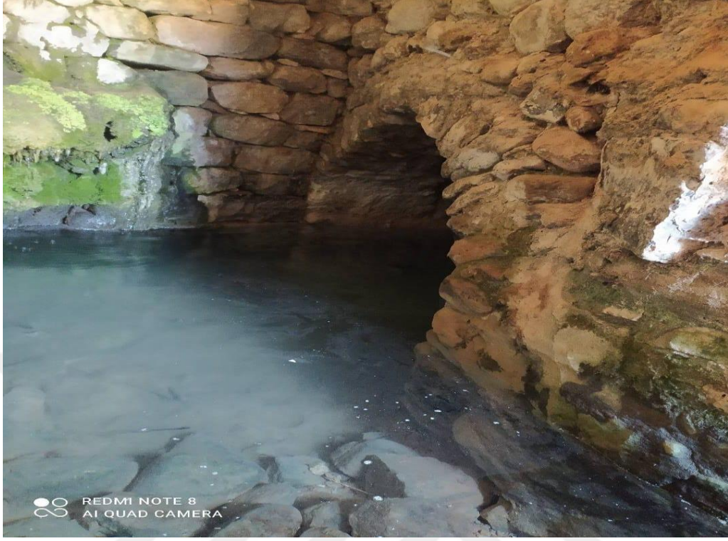
Resim 3. Bayraktepe köyünde bulunan acı pınar/acı çeşme suyu