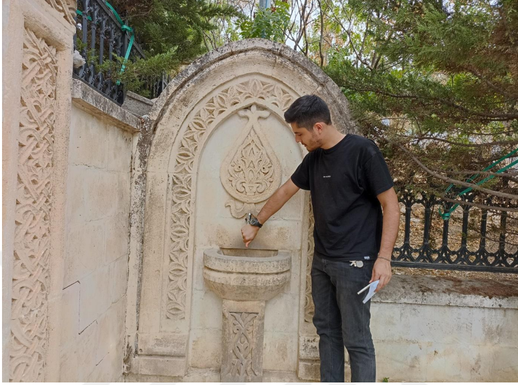
Resim 13. Şeyh Müşerref Türbesinde yer alan şifa amaçlı kullanılan su