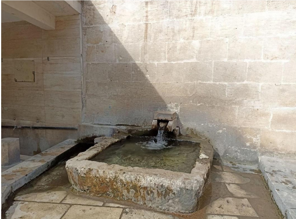
Resim 2. Şeyh Alaameddin Türbesi içerisinde yer alan şifalı su