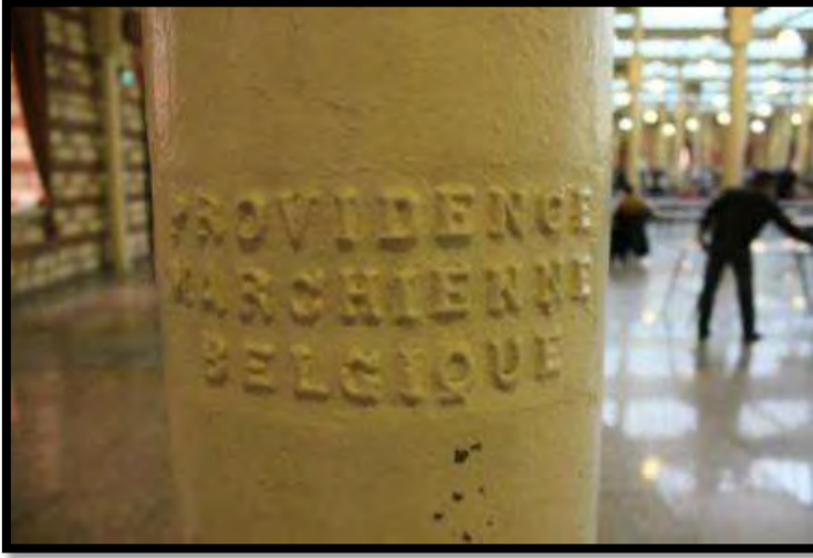
Şekil 5. Prefabrik çelik sütunlardaki “Belçika imalatı” yazısı (Çağlayan, 2013)