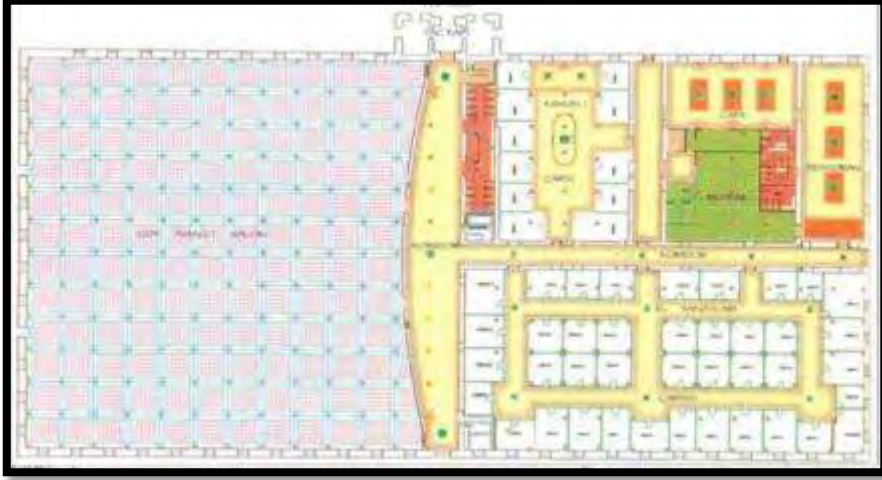
Şekil 12. 1998'deki plan kurgusu (Köksal, 2005).