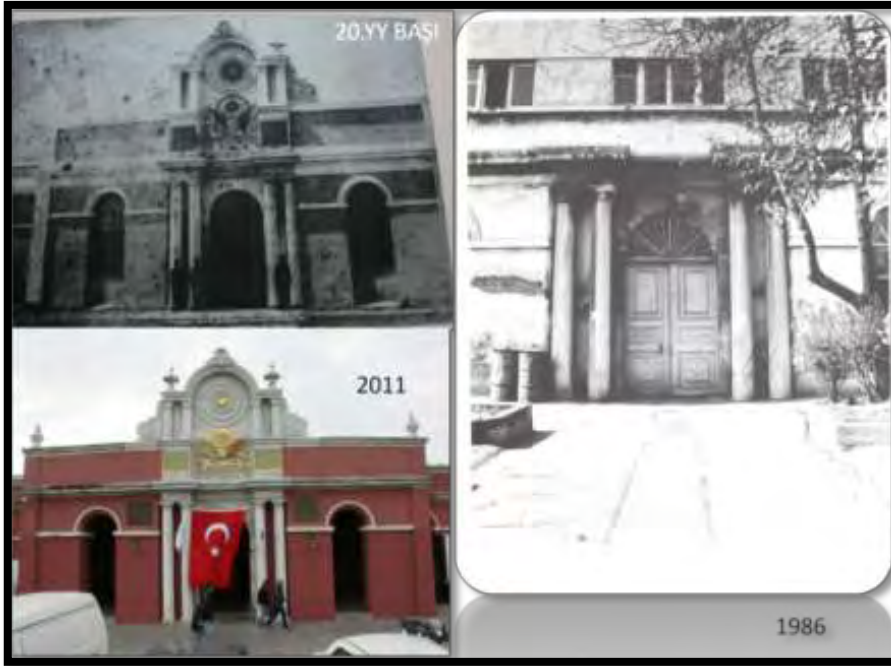
Şekil 14. Ana giriş kapısının geçmişten günümüze görünüşleri (Küçükerman, 1988; Feshane Galerisi, 2011 ve Çağlayan, 2011).