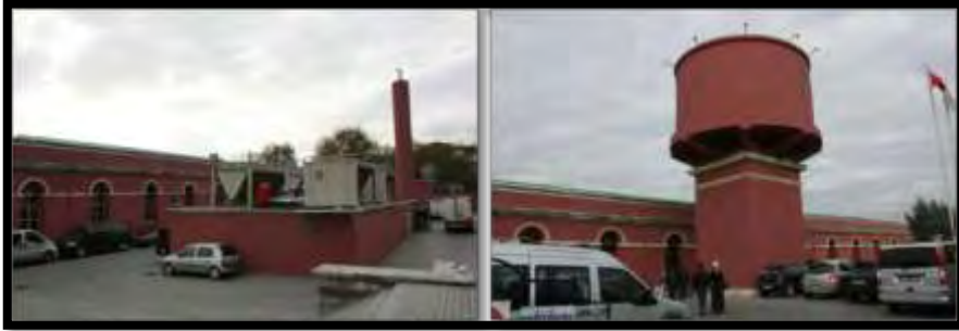
Şekil 13. Ayakta kalan boyahane ve su deposu (Çağlayan, 2013).