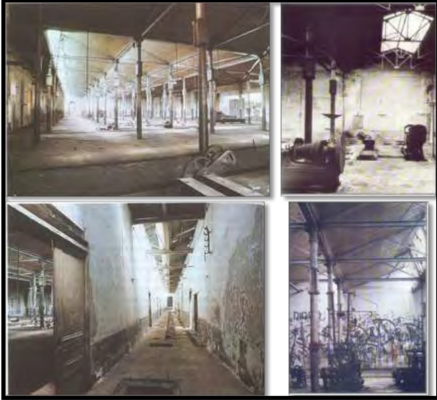
Şekil 9. Terk edildikten sonra Feshane, 1989 (Köksal, 2005).