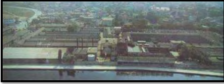
Şekil 8. Feshane'nin son günleri, 1986 (Küçükerman, 1988).