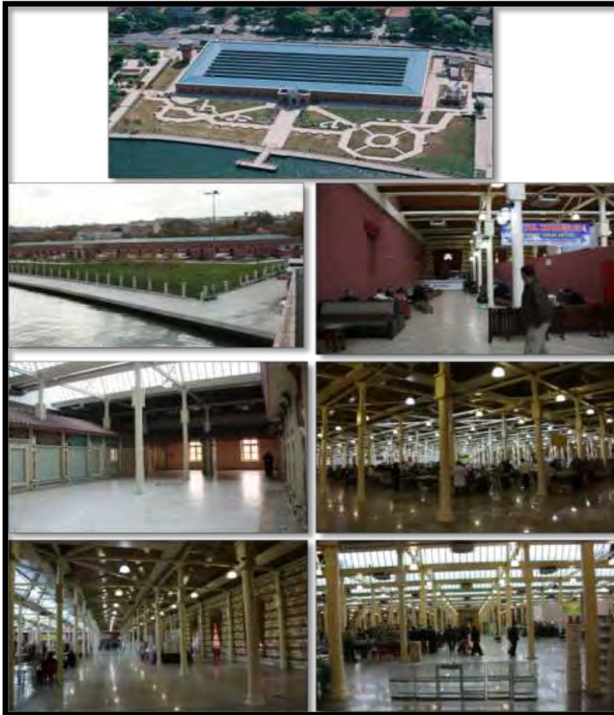
Şekil 15: Feshane'nin bugünü (Url 2, 2015 ve Çağlayan, 2015).