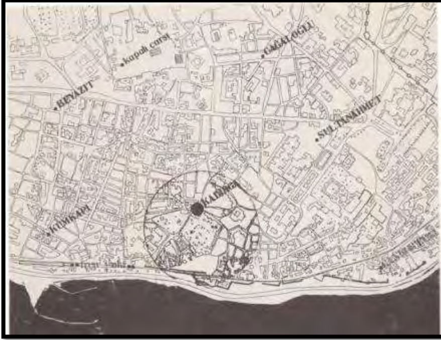
Şekil 1. İlk olarak 1835 yılında “hazine-i hassa”ya ait bir konakta kurulduğu söylenen Feshane’nin yer aldığı kadirga ve yakın çevresi (Küçükerman, 1988).