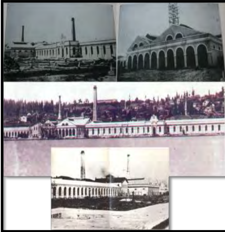
Şekil 6. 19. yüzyılsın Feshane inşa edilirken (Küçükerman, 1988 ve Feshane Galerisi, 2013).