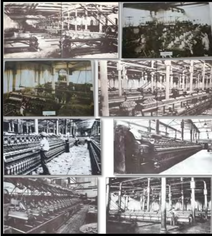
Şekil 4. 20. yüzyıl başında Feshane içindeki makine ve bölümlerden görünüm (Küçükerman, 1988 ve Feshane Galerisi, 2013).