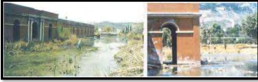
Şekil 11. Feshane sular altında, 1990 (Köksal, 2005).