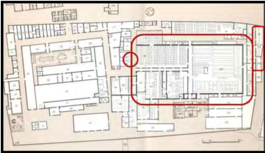
Şekil 10. Yıkılmadan önceki planı (kırmızı alanlar ayakta kalanlar).