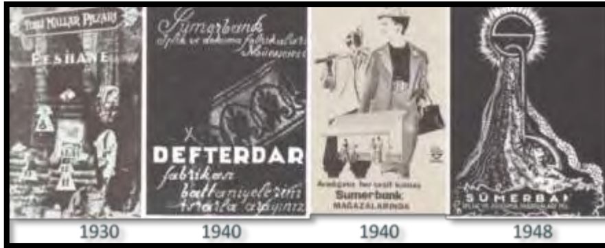
Şekil 7. Değişik dönemlerde Feshane'nin reklam afişleri (Küçükerman, 1988).