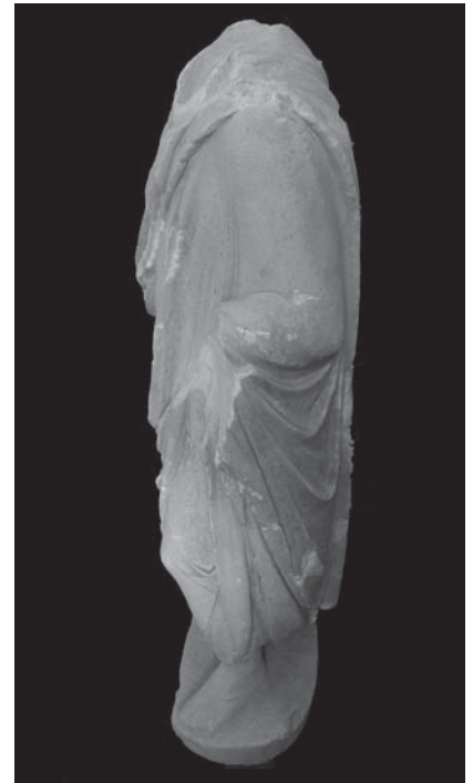
Fig. 2a, 2b, 2c. Turgut Tokuş koleksiyonu toga giyimli heykeli (cepheden, sağ ve sol yandan görünüm) (Foto. Durmuş Ersun – Umut Alagöz).