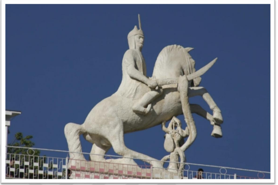
Ek 4 : Belek'in Temsili Heykeli ( https://www.google.com/search?q=Belek+heykeli Eriřim tarihi 14.10-2021)