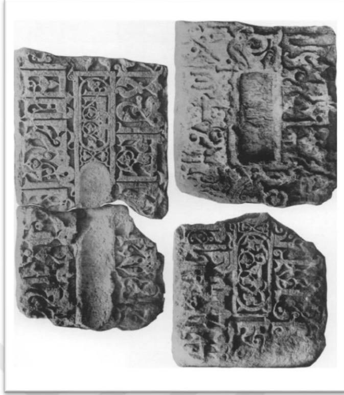
Ek 2 : Belek'in mezar kitabesine ait detaylar (Par Jean Sauvaget, "La Tombe De L'Ortokide Balak"tan alınmıştır)