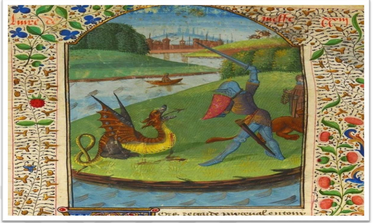
Ek 6 : Ejderha ve Şövalye'nin birlikte resmedilişi