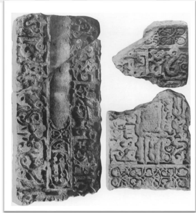
Ek 3 : Belek'in mezar kitabesine ait detaylar (Par Jean Sauvaget, "La Tombe De L'Ortokide Balak"tan alınmıştır.)