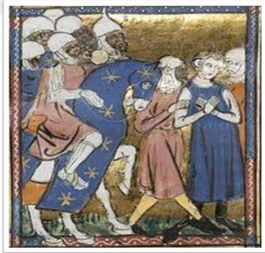
Ek 7: II. Baudouin'in esir alınması https://tr.m.wikipedia.org/wiki/II._Baudouin (Erişim tarihi 14.10.2021)