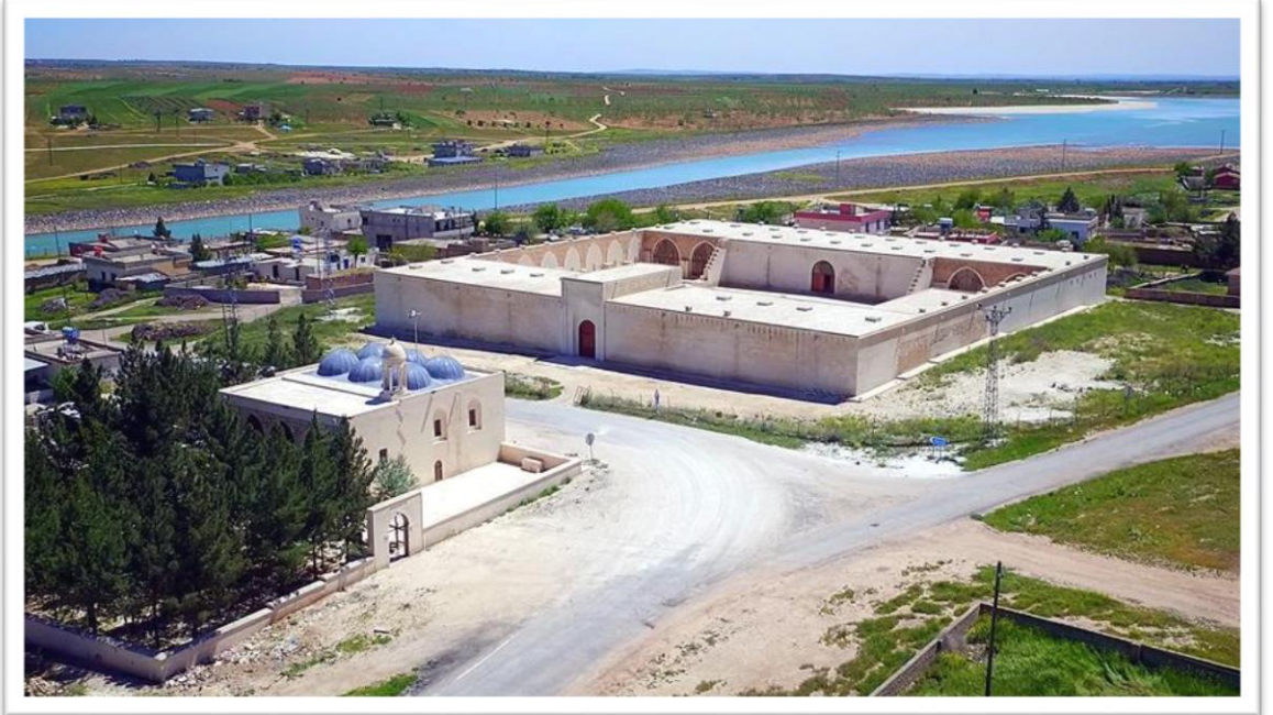
Ek 5 : Çarmelik Kervansarayı