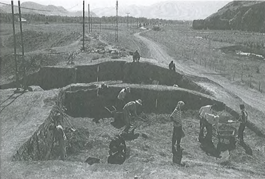
Van Kalesi Höyüğü kazı çalışmaları, 1991.

Günümüzde Türkiye'deki arkeolojik kazı ve araştırmaların sayısı hızla artmaktadır. Hatta öyle ki, Kültür Bakanlığı zaman zaman bu bilimsel etkinliklere katılacak müze temsilcilerini bulmakta bile zorluk çekmektedir. Örneğin, müzelerce yapılan kurtarma kazıları dışında, yerli ve yabancı bilim kurullarınca yapılan 1998 yılı kazılarının toplam sayısı yaklaşık 120 civarındadır. Bunlardan büyük bir bölümü de yerli ekiplerce gerçekleştirilmektedir. Bu büyük sayı kültürel zenginliğin yanı sıra fi-