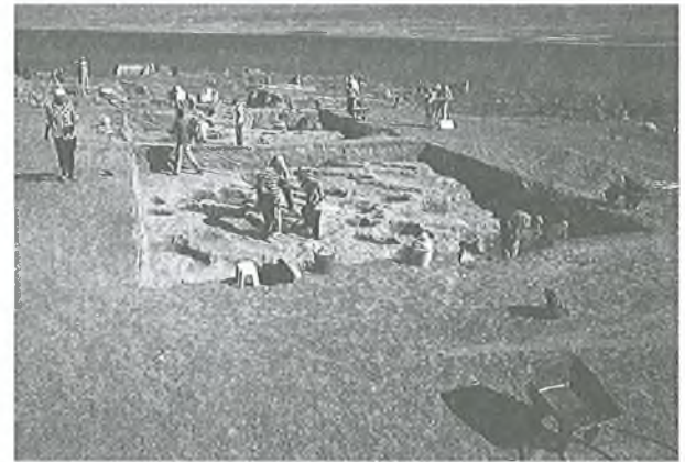
Karagündüz Hüyükü kazıları, 1998

nans sorununu da beraberinde getirmiştir. Farklı disiplinler ve birçok bilim adamının katılımıyla yapılan bu çok masraflı çalışma için geniş çaplı finansla ihtiyaç olduğu kuşkusuzdur. Kazı ve araştırma izinleri ile yerli kazılar için parasal destek sağlayan Kültür Bakanlığı, Anıtlar ve Müzeler Genel Müdürlüğü hızla artan bu sayı karşısında, özellikle müzelerle ortaklaşa yapılan kazılar için finansman konusunda çok büyük zorluk çekmeye başlamıştır.