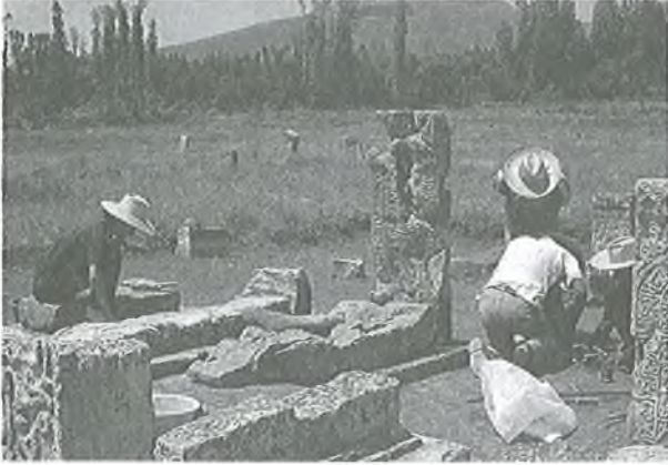
Gevaş Tarihi Türk Mezarlığı restorasyon çalışmaları, 1992