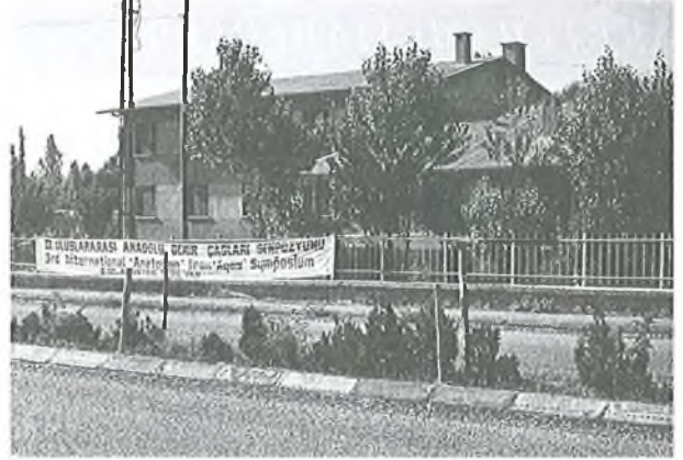
Van Bölgesi Tarih ve Arkeoloji Araştırma Merkezi.