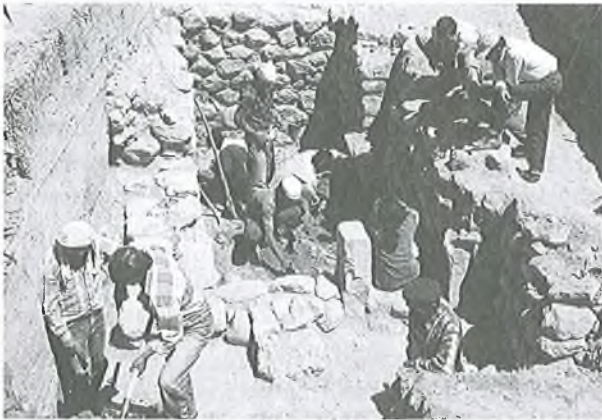
Karagündüz Nekropolü 1 no'lu mezar kazısı, 1992