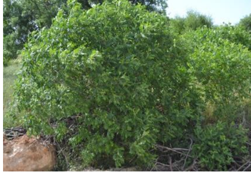
Şekil 3. Rhus coriaria . Genel görünümü

organik asitleri, fumarik asit, antosiyaninler ve fenolik bileşikler içermektedir (Ünver, 2006).