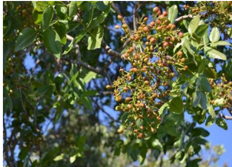
Şekil 2. Pistacia khinjuk . Meyve görünümü

Menengiçgiller familyasından olan bitki, mart-nisan aylarında çiçeklenir. 1000-1800 m yükseklikte, kayalık yamaçlar ve serpentin topraklarda yayılış gösterir. Bitki, öksürük kesici, grip, saç dökülmelerine karşı, mide ve bazı kanser hastalıkları tedavisinde kullanılmaktadır (Arasan, 2014; Kılıç,2019). Ağaç dalları mide ekşimesine, sakızı iltihaplı yara tedavisine ve mide ağrılarına, yaprağı üşütme, tohumu ise öksürük kesici ve soğuk algınlığı için tüketilmektedir (Arasan, 2014). Bitki; fenolik bileşikler, terpenoid, steroller ve yağ asitleri içermektedir (Bozorgi ve ark., 2011).