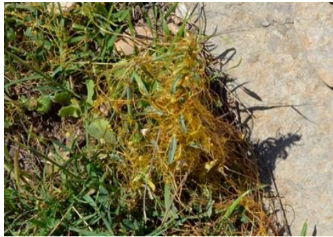
Şekil 12. Cuscuta babylonica var. babylonica . Genel görünümü

Tarlasarmaşığıiller ailesinden olan bitki, çok yıllık otlar ve çalılar üzerinde, kuru ve step alanlarda, 850-1200 m yükseklikte yayılış gösterir. Haziran-eylül ayları arasında çiçeklenme gösterir. Sarılık, böbrek hastalıkları tedavisinde ve öksürük kesici, kan temizleyici olarak da kullanılır (Kılıç, 2019). Sarılık hastalığı için çayı demlenip içilir (Şekeroğlu ve ark., 2012). Bitki bünyesinde, flavonoit, alkaloit, glikozit, steroit ve sterol, triterpen, karotenoit ve yağ asitleri içermektedir (Şen ve Bitiş, 2019).