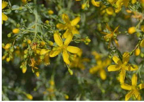
Şekil 14. Hypericum triquetrifolium . Genel görünümü