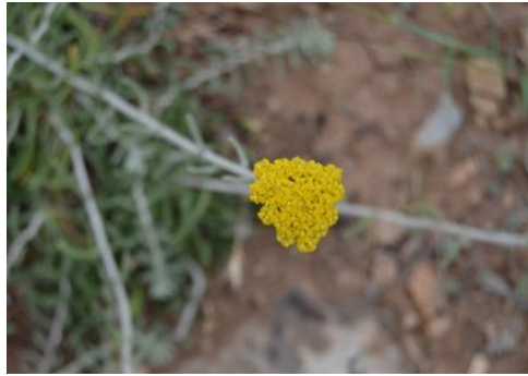
Şekil 5. Achillea aleppica subsp. aleppica . Çiçek görünümü

Papatyagiller familyasından olan bitki, step, bağ ve nadas tarlalarda 320-1000 m yükseklikte yayılış gösterir. Mayıs-temmuz ayları arasında çiçeklenme gerçekleşir. Kadın hastalıkları, diyabet tedavisinde ayrıca iltihap söktürücü olarak kullanılır (Kılıç, 2019). Çiçekleri demlenerek astım kanser tedavisinde kullanılır. Yaprakları ise yaralarda kanın durdurulması için kullanılmaktadır (Tekin, 2011). Bitki eterik yağ ve fenolik bileşikler içerir (Tonçer ve ark. 2010; Barış ve ark. 2011).