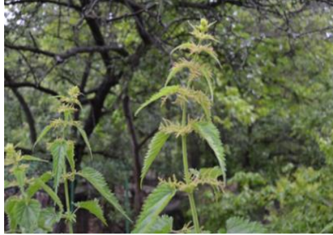
Şekil 24. Urtica dioica subsp. dioica . Genel görünümü

romatizmalı hastalıklar tedavisinde kullanılmaktadır (Kılıç, 2019). Kanser, siyatik, romatizma, idrar yolu hastalıkları, bel ağrısı ve deri hastalıklarına karşı bitki kullanılır (Erol ve Tuzlacı, 1996). Bitki flavonoid, tanen, skopoletin, sterol, yağ asiti, polisakarit, izolektin ve sterol içermektedir (Asgarpanah ve Mohajerani, 2012).