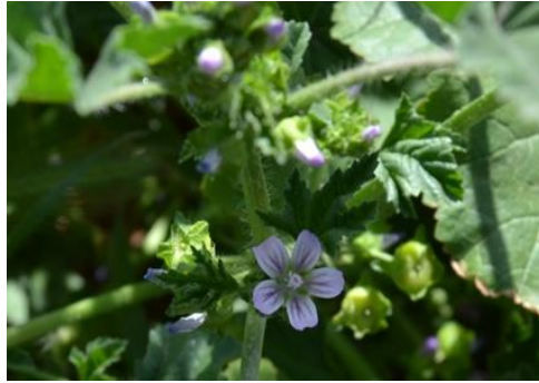
Şekil 18. Malva neglecta . Çiçek görünümü

Ebegümeçigiller familyasından olan bitki, step, tarlalar, yol kenarlarında, 0-2000 m yükseklikte yayılış gösterir. Bağırsak temizleyici, kadın hastalıkları tedavisinde, sarılık, romatizma ve idrar yolu enfeksiyonu tedavisinde kullanılır (Kılıç, 2019). Balgam söktürücü, boğaz ağrısı, astım ve bronşit rahatsızlıklarında kullanılmaktadır (Karakaya ve ark., 2019). Bitki bünyesinde müsilaj, glikoz ve pektin bulundurmaktadır (Baytop, 1999).