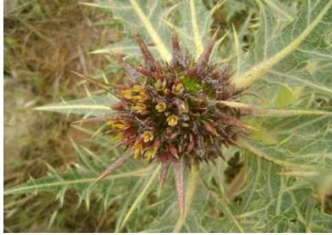
Şekil 7. Gundelia tournefortii L.'nin genel görünümü

807-1100 m yükseklikte, kayalık yamaçlar, steplerde yayılış gösteren bitki papatyagiller familyasına aittir. Mayıs ve haziran ayında çiçeklenme gösterir. Tasiyon düşürücü, mide hastalıkları ve egzema tedavisinde kullanılır (Arasan, 2014). Vitiligo hastalığının tedavisi için kullanılır (Özgökçe ve Özçelik, 2004). G. tournefortii tohumunda lineolik, oleik, palmitik, 8-oktadekenoik asit bulunur (Al-Saadi, 2017).