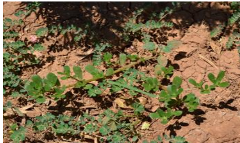
Şekil 20. Portulaca oleracea . Genel görünümü

Semizotugiller familyasından olan bitki, ekilmiş sahalar, denize yakın çorak alanlarda, 0-1000 m yükseklikte yayılış gösterir. Temmuz-kasım aylarında çiçeklenir. Bağırsak rahatsızlıkları tedavisinde kullanılır (Arasan, 2014). İştah açıcı, kurt düşürücü, idrar söktürücü, mide ve üretra enfeksiyonu tedavisinde kullanılır (Altundağ ve Öztürk, 2011). Bitki; vitaminler, mineraller, doymamış yağ asitleri, glutatyon içermektedir (Tunçtürk, 2013).