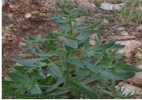
Şekil 8. Anchusa azurea var. azurea genel görünümü

Soğuk algınlığı, grip, astım tedavisinde bitkinin toprak üstü kısımları kaynatılıp, suyu içilir (Melikoğlu ve ark., 2015; Mükemre ve ark., 2015). Bitki; fenolik bileşikler, pirolizidin alkaloidi, flavonoidler, triterpenler ve saponinler taşır (Kuruüzüm ve ark., 2013).