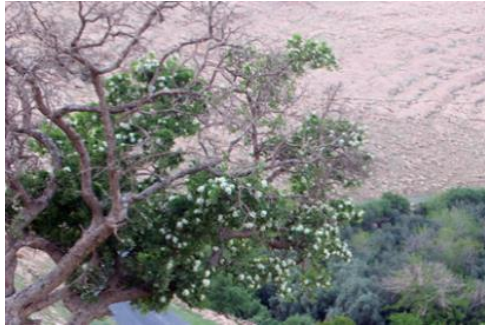
Şekil 23. Crataegus azarolus var. azarolus . Genel görünümü

Gülgiller familyasından olan tür, meşe çalılıkları, kalkerli yamaçlarda, 0-1600 m yükseklikte yayılış gösterir. Nisan- haziran ayında çiçeklenme gösterir. Kalp, böbrek ve diyabet hastalıkları için tüketilmektedir (Kılıç, 2019). Dolaşım sistemi bozukluklarında ve şeker hastalığına tedavisinde kullanılmaktadır (Altundağ, 2009). Bitki içerisinde, fenol, flavonoid, klorojenik asit ve hiperosit bulunmaktadır (Bahri-Sahloul, 2014).