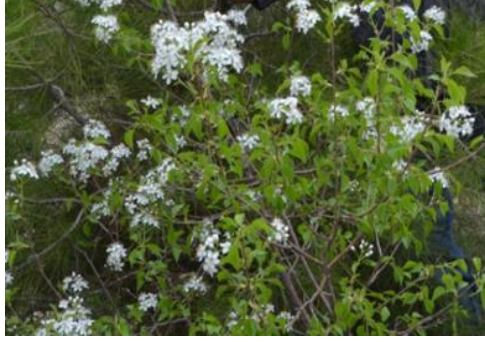
Şekil 22. Cerasus mahaleb var. mahaleb . Genel görünümü