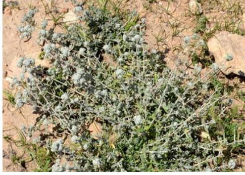
Şekil 16. Teucrium polium subsp. polium . Genel görünümü

Ballıbabagiller familyasından olan bitki, 0-2050 m yükseklikte, meşe çalılırları, kayalık yerler, kumullar ve tarla kenarlarında yayılış gösterir. Haziran-eylül aylarında çiçeklenme gösterir. Diyabet, astım, bronşit, ülser hastalıklarının tedavisinde kullanılır (Kılıç, 2019). Nefes darlığı, romatizmal ağrılar, soğuk algınlığı, diyabet, mide ağrısı ve bazı kanser türevlerinin tedavisi için kullanılır (Mükemre ve ark. 2015). Bitkinin toprak üstü organları eterik yağ içermektedir (Baytop, 1999).