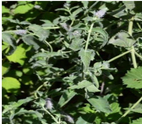
Şekil 15. Mentha longifolia subsp. typhoides . Genel görünümü

Ballıbabagiller familyasına ait olan bitki, 900-2135 m yükseklikte, dere kenarları ve bataklık tarlalarda yayılış göstermektedir. Temmuz-ekim ayları arasında çiçeklenme gösterir. Soğuk algınlığına, nezle, öksürük ve ishale karşı kullanılır (Kılıç, 2019). Mide rahatsızlığı, soğuk algınlığı ve romatizmal ağrıların iyileşmesinde bitkinin yaprakları çay gibi demlenip içilir (Balos, 2007). Bitki yaprağı; luteolin, luteolin türevleri, apigenin türevleri ve rozmarinik asit türevleri içermektedir (Abak, 2018).