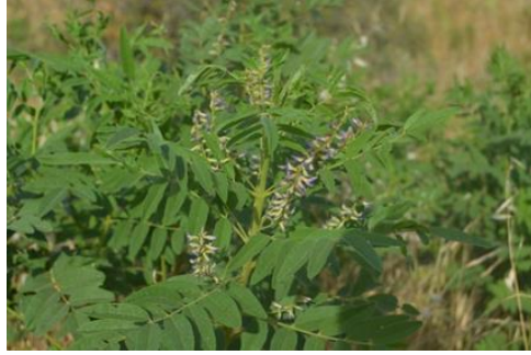
Şekil 13. Glycyrrhiza glabra var. glabra . Genel görünümü

Baklagiller familyasından olan bitki, ekilmiş tarlalar, alüvyonlu nehir vadilerinde ve kumullarda, 0-1800 m yükseklikte yayılış gösterir. Haziran-temmuz aylarında çiçeklenme gösterir. Kadın hastalığı, Karaciğer, böbrek hastalığı ve öksürük için tüketilir (Kılıç, 2019). Bitkinin kökü göğüs yumuşatıcı, balgam söktürücü ve idrar artırıcı olarak kullanılır. Bitkinin kökünde; nişasta, zamk, rezin, flavon türevleri ve glisirizin bulunmaktadır (Baytop, 1999).