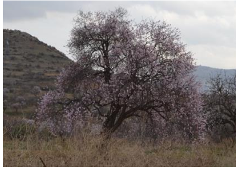
Şekil 21. Amygdalus communis . Genel görünümü

Gülgiller familyasından olan tür, doğal ve kuru yamaçlar, kalkerli geçitler, çalı ve meşe ağaçları arasında, 150-1800 m yükseklikte yayılış gösterir. Mart-nisan aylarında çiçeklenir. Diyabet hastalığı ve böbrek rahatsızlıkları tedavisinde kullanılmaktadır (Yapıcı ve ark., 2009). Göğüs yumuşatıcı, öksürük kesici, idrar arttırıcı ve kurt düşürücü olarak tüketilmektedir. Bitki tohumu protein, selüloz, glikozit (amigdalın) ve sabit yağ içermektedir (Baytop, 1999).