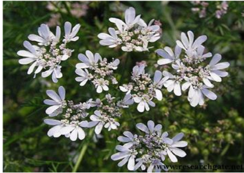
Şekil 4. Rhus coriaria . Çiçek görünümü

Maydanogiller ailesinden olan bitki, çorak alanlar, nadas tarlalar da, 320-1300 m yükseklikte yayılış gösterir. Mayıs-haziran aylarında çiçeklenir. Tansiyon düşürme ve bağırsak iltihapları tedavisinde kullanılır (Arasan, 2014). Tohumlarından hazırlanan çay iştah açar, sindirim sistemini düzenler ve sinirleri yatıştırır (Bulut, 2006). Bitki içerisinde, eterik yağ, yağ asidi, rezin, vitamin, tanen ve karbonhidrat, protein, P ve Fe gibi mineraller içermektedir (Baytop, 1999; Ulutaş ve ark., 2018).