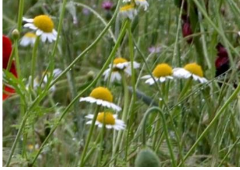
Şekil 6. Anthemis cotula . Çiçek görünümü