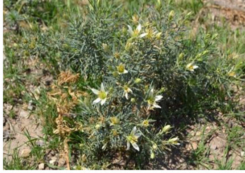
Şekil 19. Peganum harmala . Genel görünümü

kullanılmaktadır (Kılıç, 2019). Bitki mide hastalıkları, diş ağrıları ve basur için tüketilmektedir (Balos, 2007). Bitki tohumlarında sabit yağ ve alkaloit bulunmaktadır (Baytop, 1999).