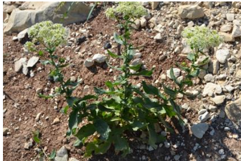
Şekil 9. Lepidium draba genel görünümü

Turpgiller familyasından olan bitki, ekili alan, yol kenarlarında, 0-1300 m yükseklikte yayılış gösterirler. Nisan-mayıs aylarında çiçeklenme gösterir. Bağırsak kanseri riskini azaltmak, sindirim sistemi rahatsızlıkları, diyabet, kalp hastalıkları için kullanılmaktadır (Kılıç, 2019). Sakinleştirici, sinirleri yatıştırıcı ve strese karşı bitkinin toprak üstü kısımları kullanılır (Furkan, 2016). Bitki içerisinde fenoller, alkaloidler ve terpenoidler bulunmaktadır (Al-Marzoqi, 2015).