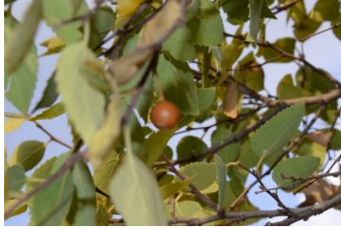
Şekil 11. Celtis tournefortii . Meyve görünümü