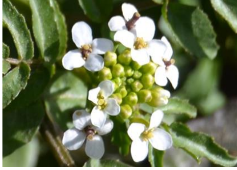
Şekil 10. Nasturtium officinale . Çiçek görünümü

Turpgiller familyasına ait olan bitki, gölet, dere kenarlarında 0-1650 m yüksekliğinde yayılış gösterir. Mart-temmuz aylarında çiçeklenir. İdrar yolları ve mide rahatsızlıkları tedavisinde kullanılır (Arasan, 2014). Kadın hastalıkları, cilt güzelliği, sivilceler, müshil etkisi, idrar ve balgam söktürmek için kullanılmaktadır (Akan ve Bakır-Sade, 2015). Bitki; glikozit, A, C ve D vitaminleri ile eterik yağ içermektedir (Baytop, 1999).