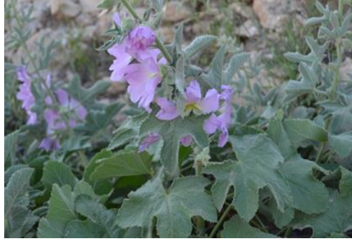
Şekil 17. Mentha longifolia subsp. typhoides . Genel görünümü