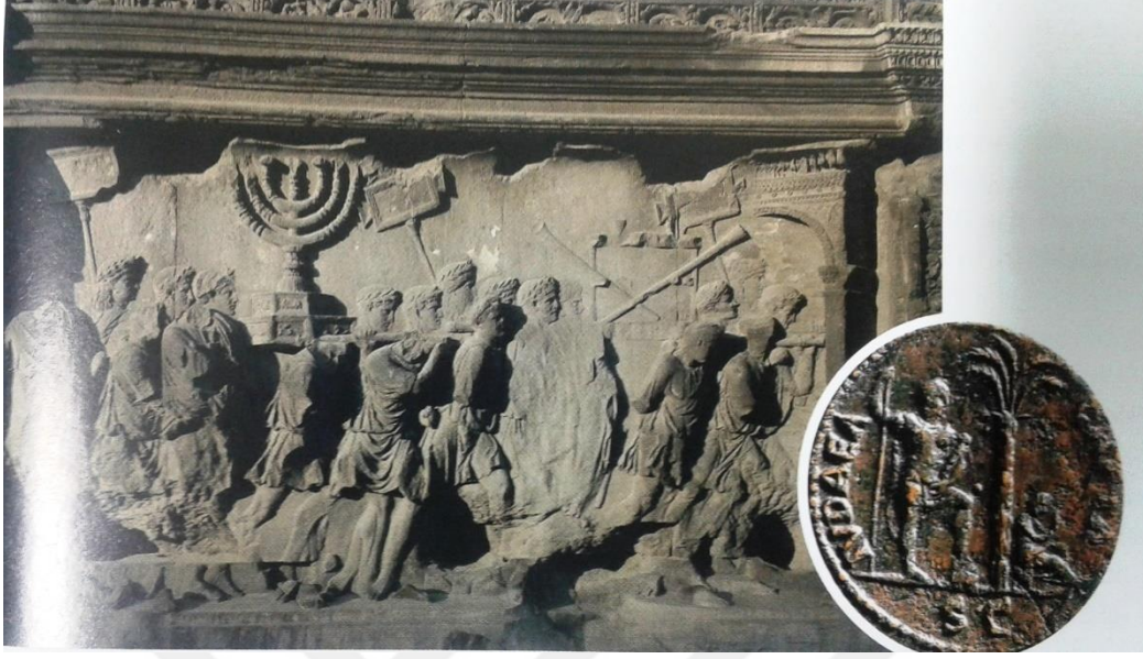
Fotoğraf 3: Titus'un Kudüs'ü tahrip ettikten sonra Yahudilerin kutsal altı kollu şamdanını Roma'ya götürmesinin temsili ve zaferin anısına basılan üzerinde JeduaCapta yazan para. (Montefiore, Kudüs Bir Şehrin Biyografisi , s. 176-177).