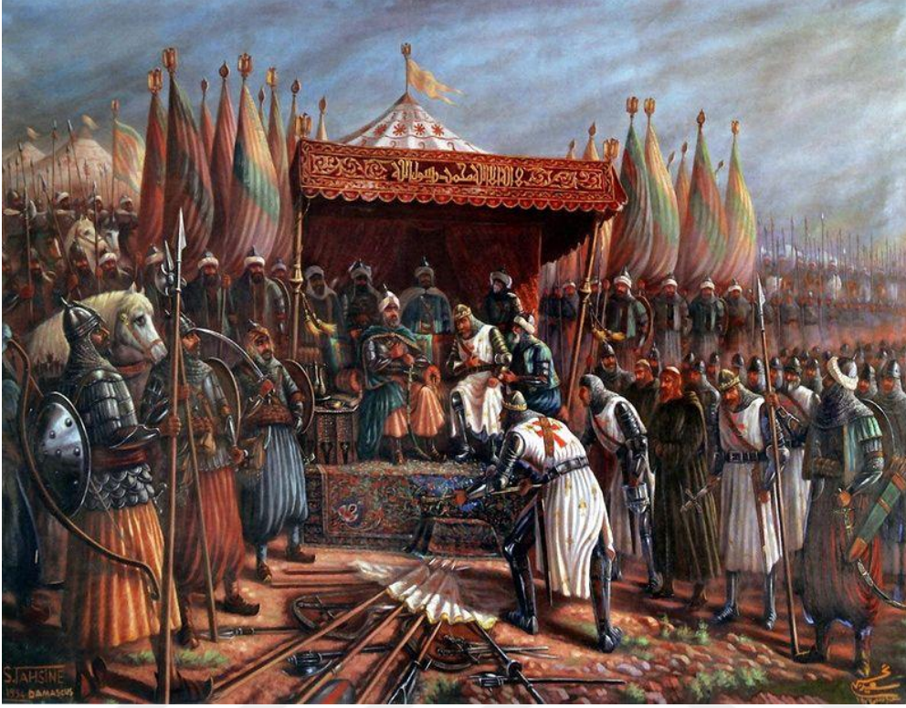
Fotoğraf 6: Hittin Savaşı'ndan sonra Haçlılar Selahaddin'in huzurunda (1187).