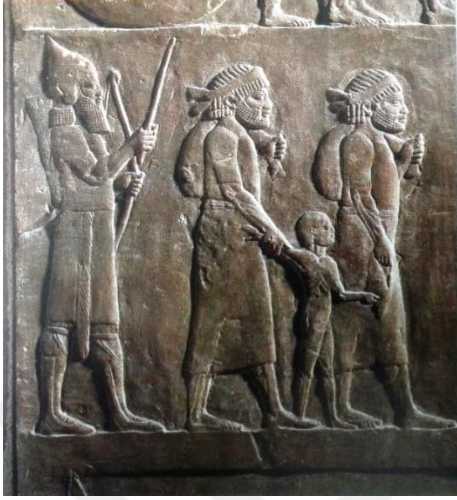
Fotoğraf 1: Sanharib'in Yahudileri sürgün edişii. (Montefiore, Kudüs Bir Şehrin Biyografisi , s. 176-177).