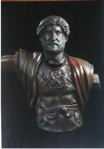
Fotoğraf 4: Kudüs'ü yeniden imar eden ve ismini veren İmparator Hadrian (AeliaCapitlia). (Montefiore, Kudüs Bir Şehrin Biyografisi , s.176-177).