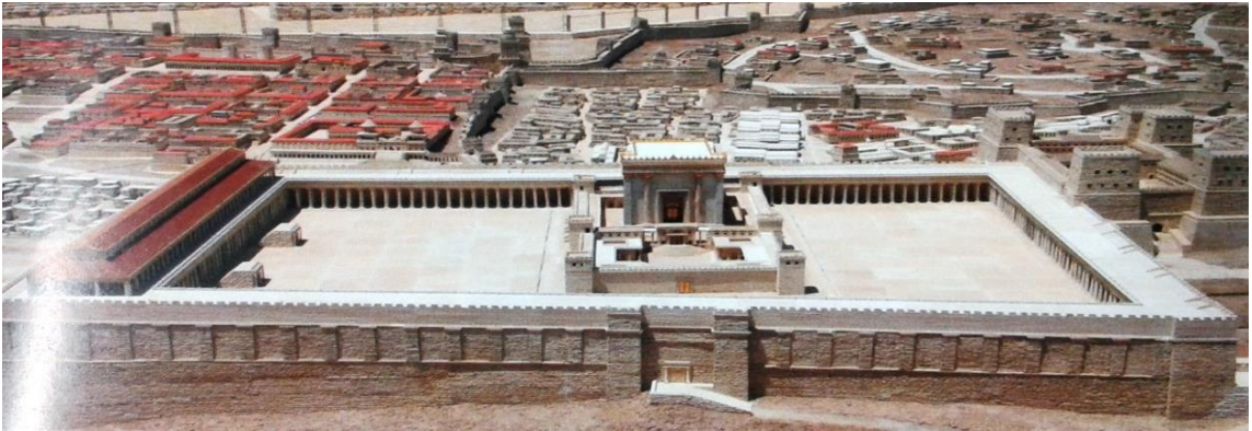
Fotoğraf 7: Hirodes'in Kudüs'te yaptırdığı Mabel-Tapınak'ın temsili resmi (Montefiore, Kudüs Bir Şehrin Biyografisi , s. 176-177).