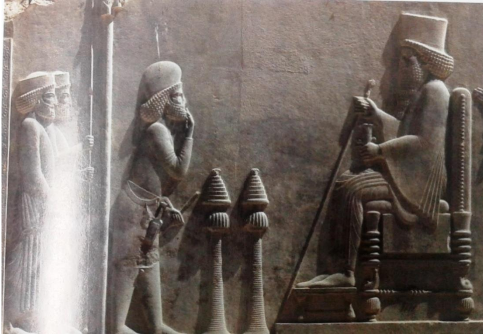
Fotoğraf 2: Kral Darius'un Yahudilerin Kudüs'te Mabel'di inşa etmelerine müsaade edişinin temsili. (Montefiore, Kudüs Bir Şehrin Biyografisi , s. 176-177)