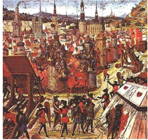
Fotoğraf 5. Haçlıların Beytülmakdis'i işgali. https://www.beyz tarih.com/kudus-tarihi/kadim-sehir-ve-hakimiyet-mucadelesi-kudus (Erişim 10.03.2019).