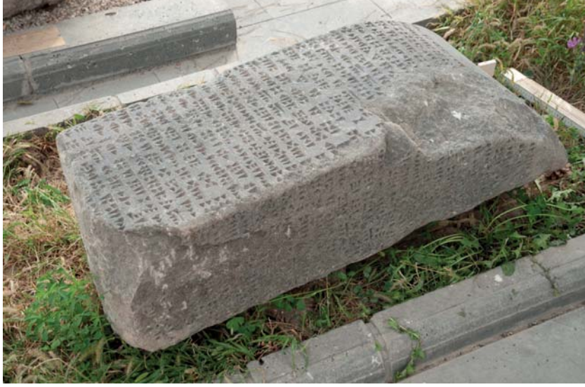
Resim 17. Surp Boğos Kilisesi'nde Yapı Malzemesi Olarak Kullanılan Stel Parçası Analıkız Batı Nişindeki Stelin Üst Kısımına Aittir.