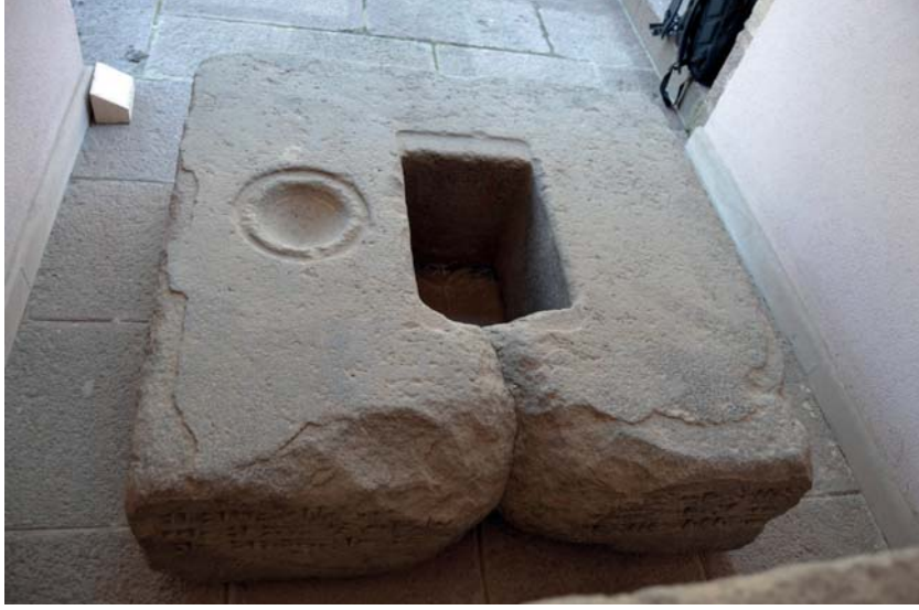
Resim 21. Minua Dönemine Ait Gameşvan/Kamışvan (Patnos/Değirmendüzü) Yazıtlı Stel Kaidesi.