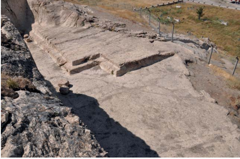
Resim 8. Analıkız Alanı Batı Niş Önündeki Platform ve Sekiler.