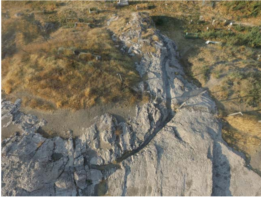
Resim 18. Analıkız Alanı'nın Kuzeyine Doğru Uzanan Kanal.