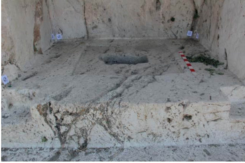
Resim 10. Analıkız Doğu Nişi Stel Yuvası.