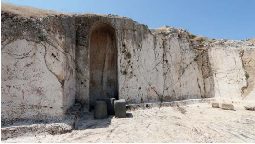
Resim 11. Analıkız Batı Nişi.