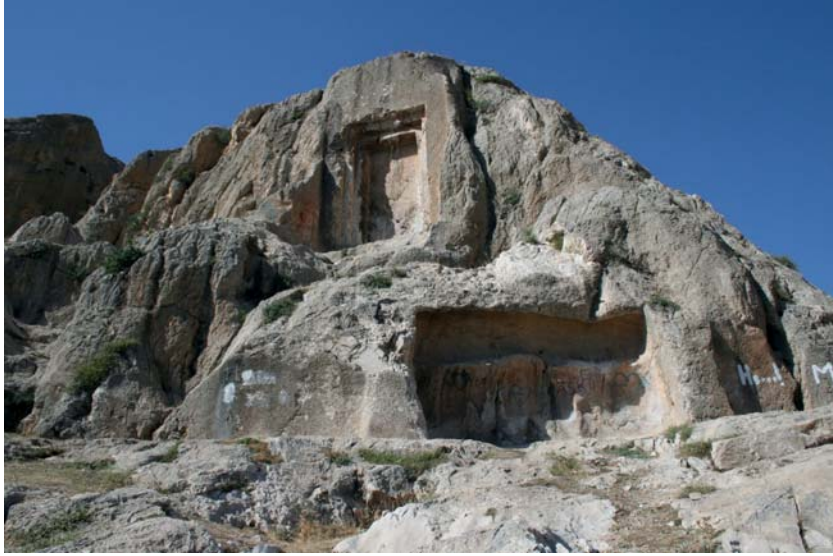
Resim 7. Meher Kapı Kaya Anıtı.