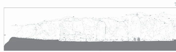
Resim 4. Analıkız Alanı Cephe Görünüşü.