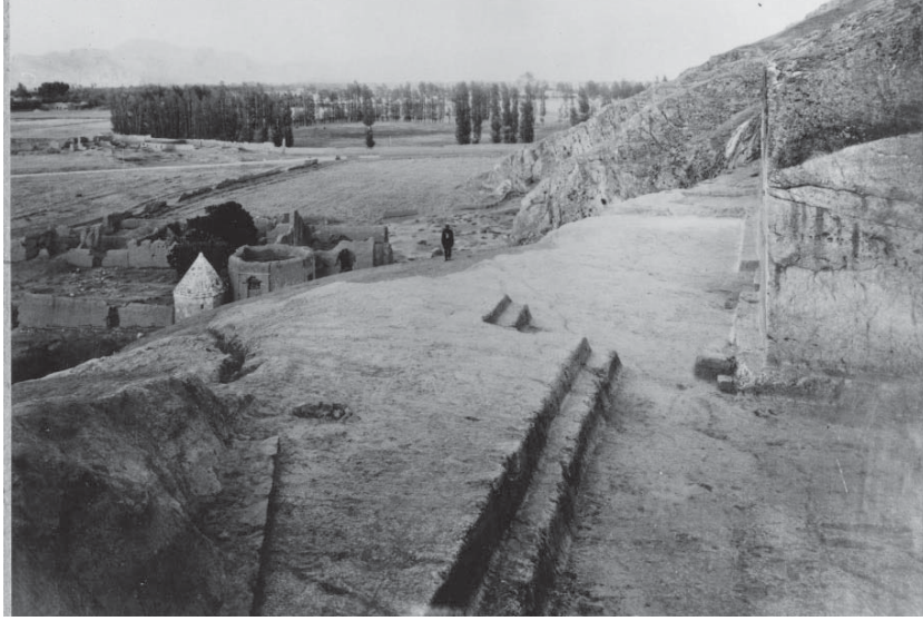
Resim 19. K. Lake'in 1938 Yılında Yaptığı Kazılardan Sonra Analıkız Alanı.