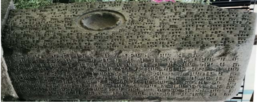
Resim 20. Surp Boğos Kilisesi'nde Yapı Malzemesi Olarak Kullanılan Minua Dönemi Stel Kaidesi.