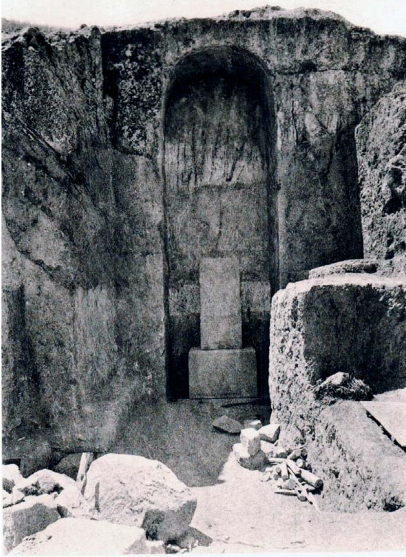
Resim 16. Analıkız Batı Nişi ve II. Sarduri Yıllıklarının Bulunduğu Stel ve Stel Kaidesi 1916 Yılında Yapılan Kazılar Sonucunda Ortaya Çıkarılmıştır (Marr - Orbeli 1922).