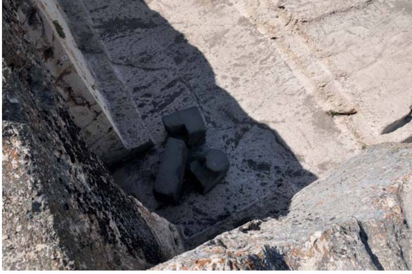
Resim 14. Analıkız Batı Niş Önündeki Stel Yuvalı Kaide.