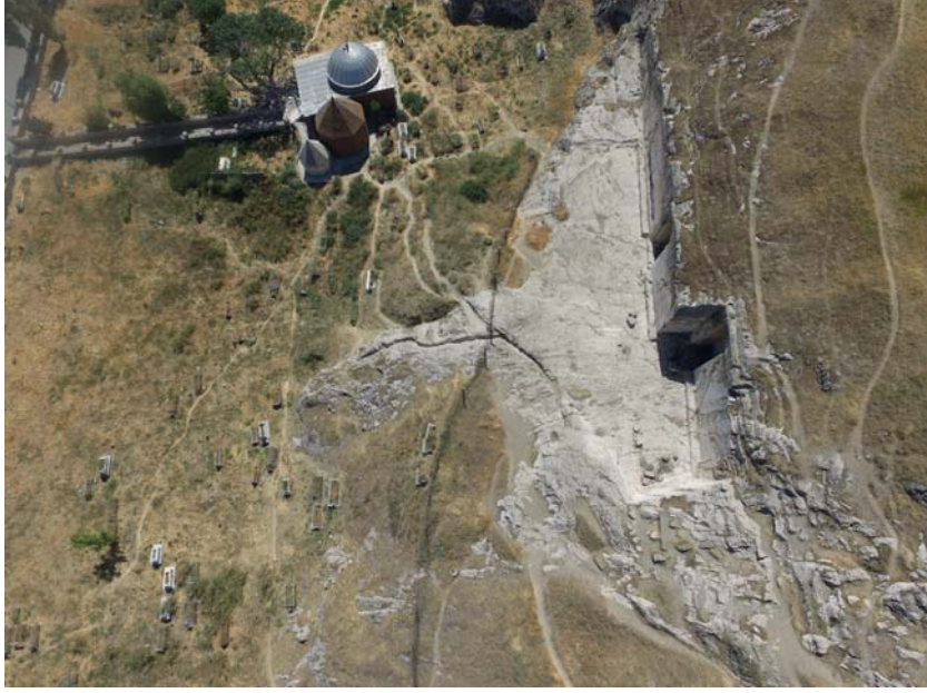
Resim 23. Anlıkız Alanı'nın Kuzeyinde ve Batısında Yer Alan Temel Yatakları.