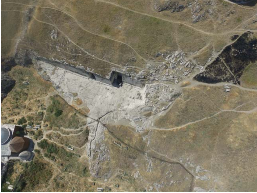
Resim 1. Analıkız Alanı ve Yakın Çevresi, Havadan.