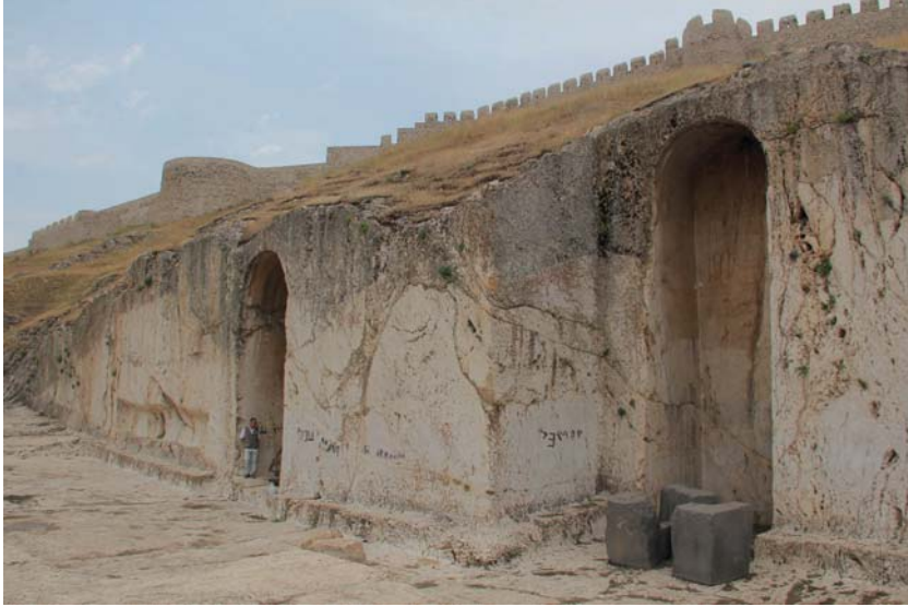
Resim 9. Analıkız Alanı Doğu ve Batı Nişler, Batıdan.