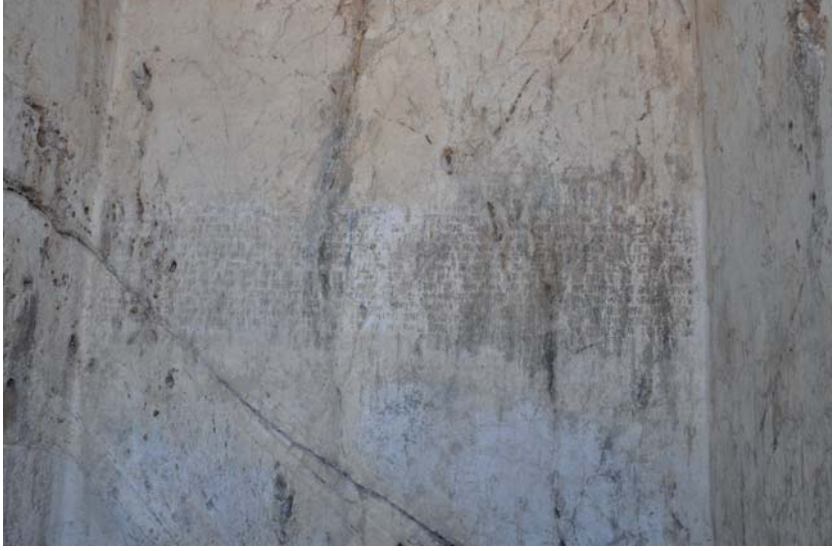
Resim 12. Analıkız Batı Nişinin, Ön Yüzündeki Çivi Yazısı.