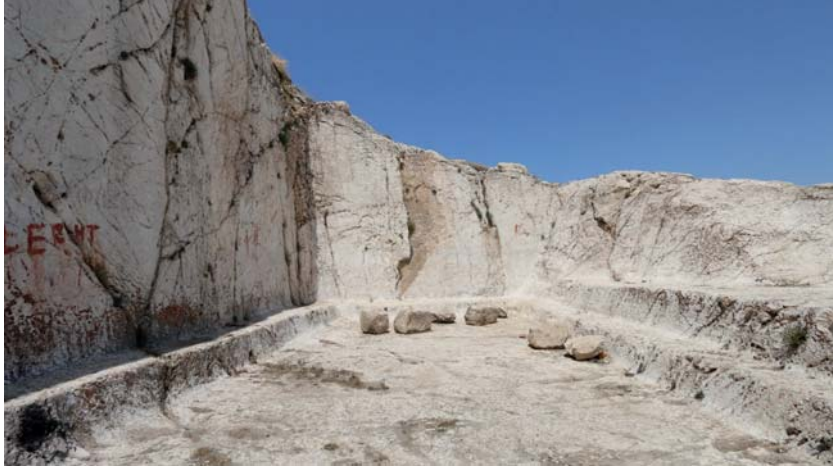
Resim 22. Analıkız Alanı Batı Niş Önü ve Batıya Doğru Uzanan Sekili Alan.