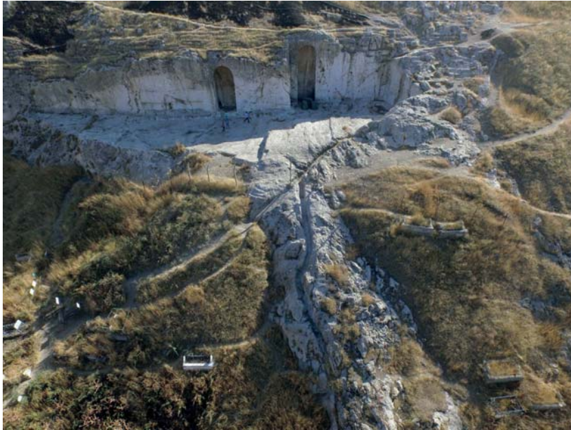
Resim 2. Analıkız Alanı Genel Görünüm, Kuzeyden.