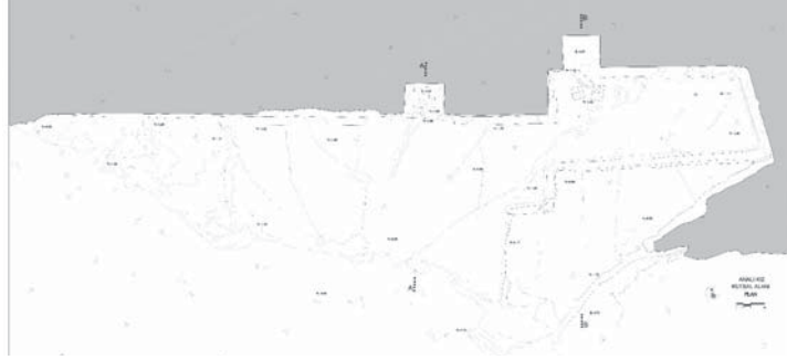
Resim 3. Analıkız Alanı Planı.