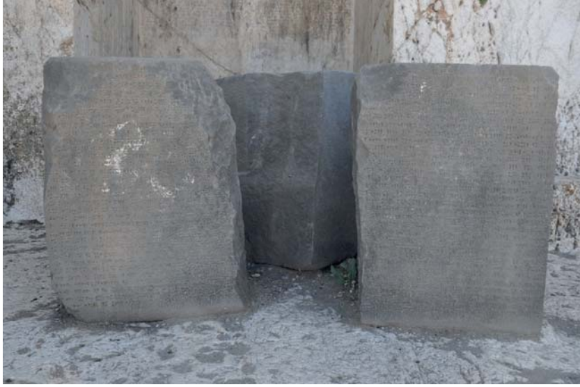
Resim 15. Analıkız Batı Niş Önündeki Stel Kaidesi Üzerindeki Yazıt.