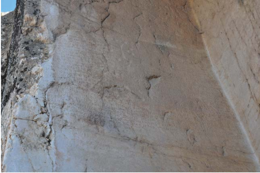
Resim 13. Analıkız Batı Nişinin, Doğu (Sol) Yüzdeki Çivi Yazısı.