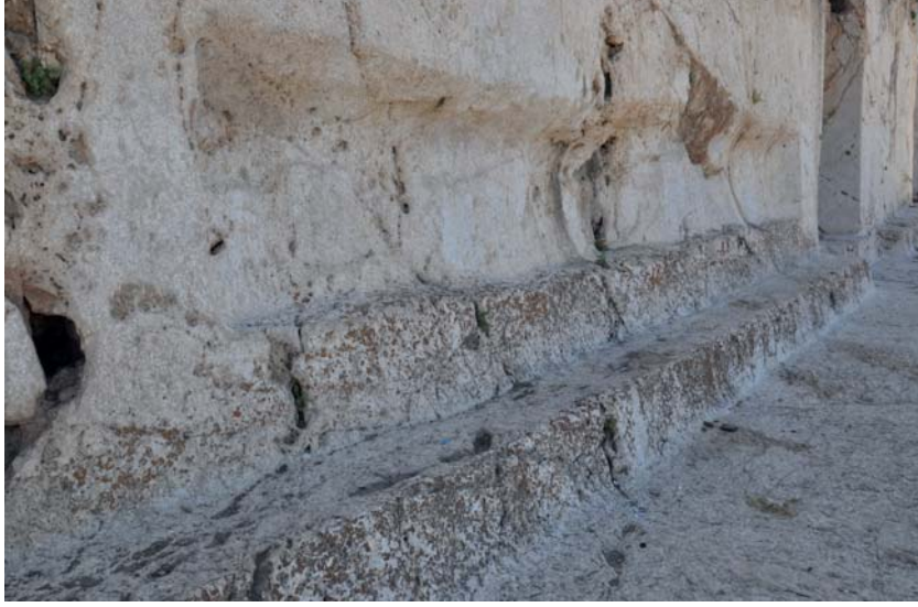
Resim 6. Analıkız Alanı, Doğu Nişin Solundaki Oyuk ve Sekiler.