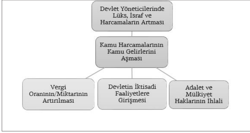
Şekil 1. Devletin Bozulmaya Başlamasının Mali/İktisadi Nedenleri

Yukarıda yapılan doğrudan yapılan aktarmalar, Şekil 1.'de gösterilmiş olup sayılan her bir husus şu 3 unsura işaret etmektedir: