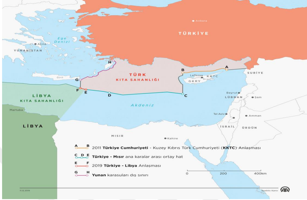
Harita 3: Türkiye ile Libya Arasında İmzalanan MEB Anlaşması 48

Türkiye'nin uluslararası camia tarafından tanınan UMH'yi desteklemesi ve onunla deniz yetki alanlarının belirlenmesine yönelik anlaşma ile askeri ve güvenlik alanlarında yaptığı mutabakatlar Sisi rejimini son derece rahatsız etmiştir. Çünkü Türkiye ile Libya arasında yapılan münhasır ekonomik bölge anlaşması Yunanistan ile Mısır arasındaki MEB'in geçersiz olmasına bunun da Mısır'ın çıkarlarına aykırı olması hasebiyle son derece sıkıntı görmesine sebep olmuştur. Mısır bundan dolayı, Türkiye'nin uluslararası hukuka aykırı hareket ettiği tezini savunmuştur. Bu tezinin hayata geçmesi için de uluslararası kurumlardan destek almak için BM nezdinde Türkiye'yi şikayet ederek Türkiye'nin bölgedeki etkinliğine engel olmaya çalışmıştır. Ayrıca Sisi yaptığı bir açıklamada Libya meselesinin Mısır'ın iç meselesi olduğunu ve dış güçlerin Libya'yı kontrol etmesine engel olacaklarını belirtmiştir. 49 Mısır, Türkiye'nin Libya'daki UMH'ye verdiği askeri desteğe karşılık Hafter güçlerine karşı açık bir şekilde destek vermeye başlamıştır. Hafter'in Trablus