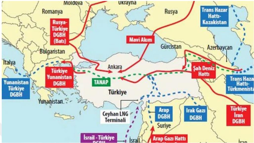
Harita 2: Türkiye'nin Doğu Akdeniz Boru Hattı Projesi 16

Türkiye ile Mısır ilişkilerinin 2013 yılında Mısır'da gerçekleşen askeri darbe ile gerginleşmesi iki ülkeyi birbirinden uzaklaştırmıştır. Yeni Kahire yönetiminin, Türkiye'nin darbe karşısında sert tutumuyla birlikte izlediği dış politikada Ankara yönetimi karşıtı bir çaba içerisine girmesine neden olmuştur. Doğu Akdeniz'de Mısır-GKRY-Yunanistan arasında münhasır ekonomik bölgenin ilan edilmesi, Doğu Akdeniz'de en geniş kıyıya sahip Türkiye'nin dar bir su alanına sıkıştırılmasına neden olacağından Türkiye bu girişime bir beka meselesi olarak bakmıştır. Ayrıca Mısır, İsrail, Yunanistan ve GKRY'nin kurabileceği bir askeri ittifakın yol açacağı Türkiye'nin güney sınırlarında büyük bir tehdidin algısı Ankara hükümetinin de bu girişimlere karşı atakta bulunmasını gerekli kılmıştır. 17